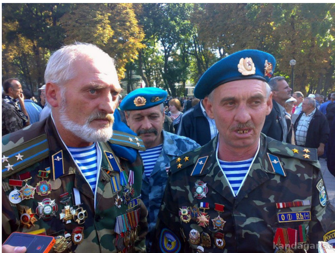
Ветераны необъявленных войн

– Что ты, дядя, афганцы уже давно на пенсии.