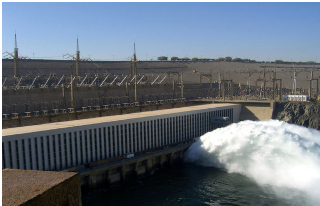
Первая ГЭС на Ниле

В 1970 году плотина была построена и стала памятником Насеру, покинувшему мир в том же году. Памятник впечатляет: объем сооружения равен примерно 17-ти пирамидам Хеопса, ширина плотины у основания достигает 1000 м, длина – 4600 м, высота – 111 м.