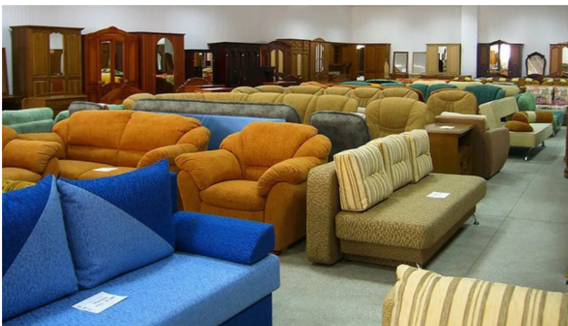
Салон был пуст и ждал покупателей

Света была хороша, и всего-то у нее было в меру и рост и фигура. На милом личике, выделялись глаза, они были необычные, серые с золотистым ободком. Вовка уже видел, как на солнце они просто сияли. Именно тогда, когда он впервые увидел это сияние он и был сражен, хотя окончательно это он уразумел чуть позже, вернувшись после той встречи домой.