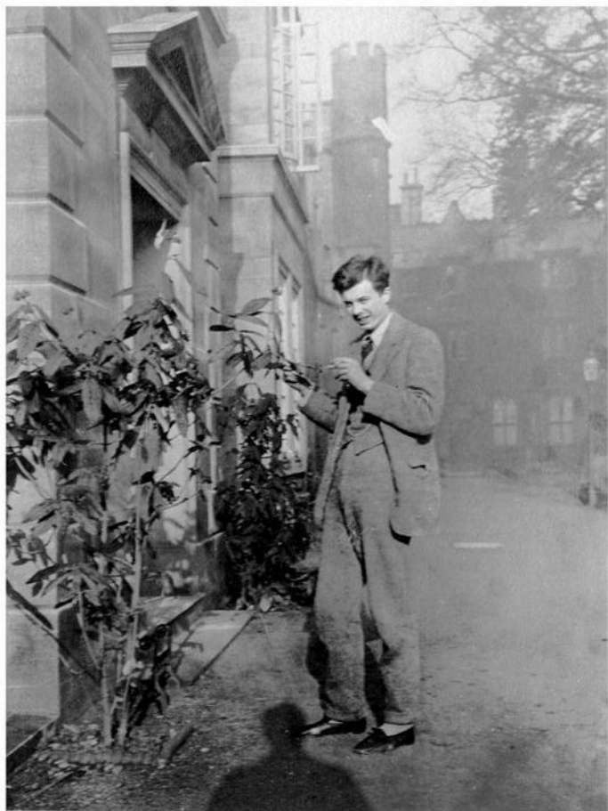
Aldous Huxley & his favourite shrub

Ил. 4. О. Хаксли и его «любимый куст». Колледж Баллиол.