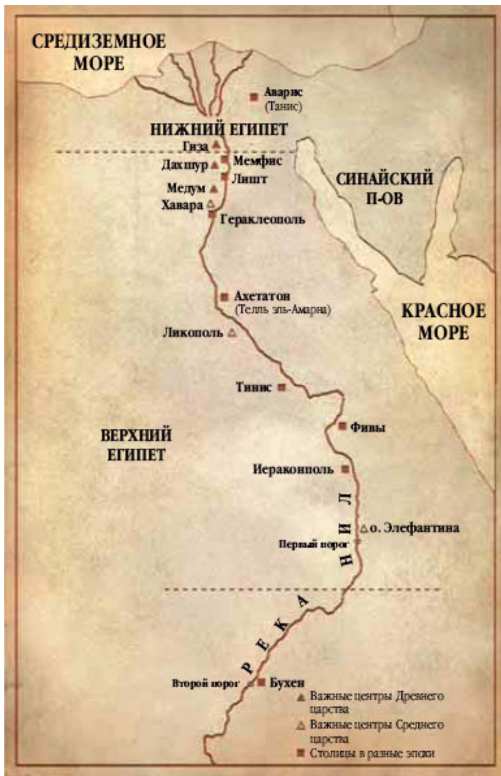
Карта Египта с основными центрами древности