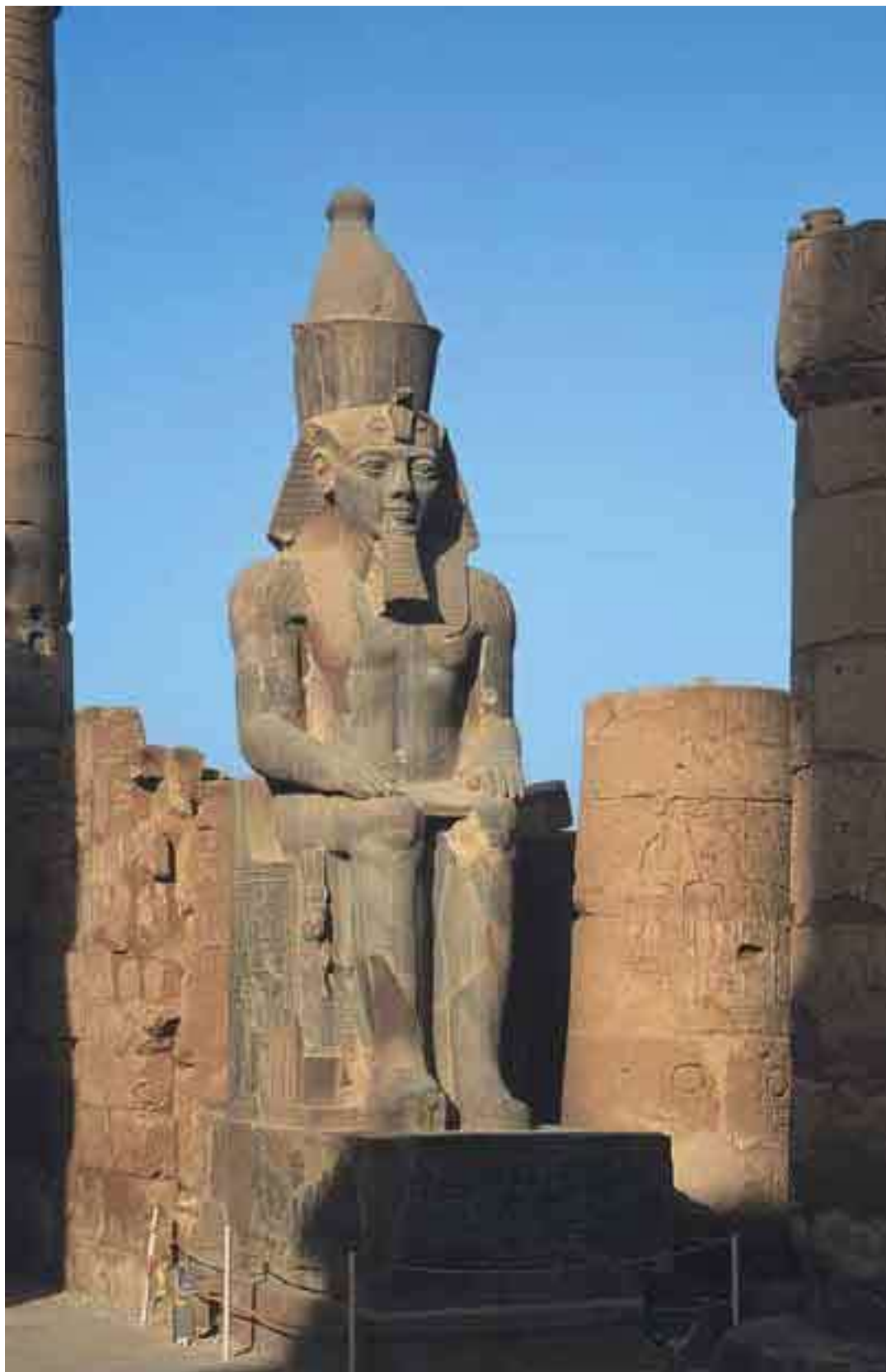
Колосс Рамсеса II. XIX династия. Храм в Луксоре

Некоторые авторы относят к нему III переходный период – время царствования XXI династии в Танисе и других городах Севера и Юга: государство, распавшись на части, вновь вступило в эпоху феодализма, или средневековья. За этим периодом последовала Ливийская