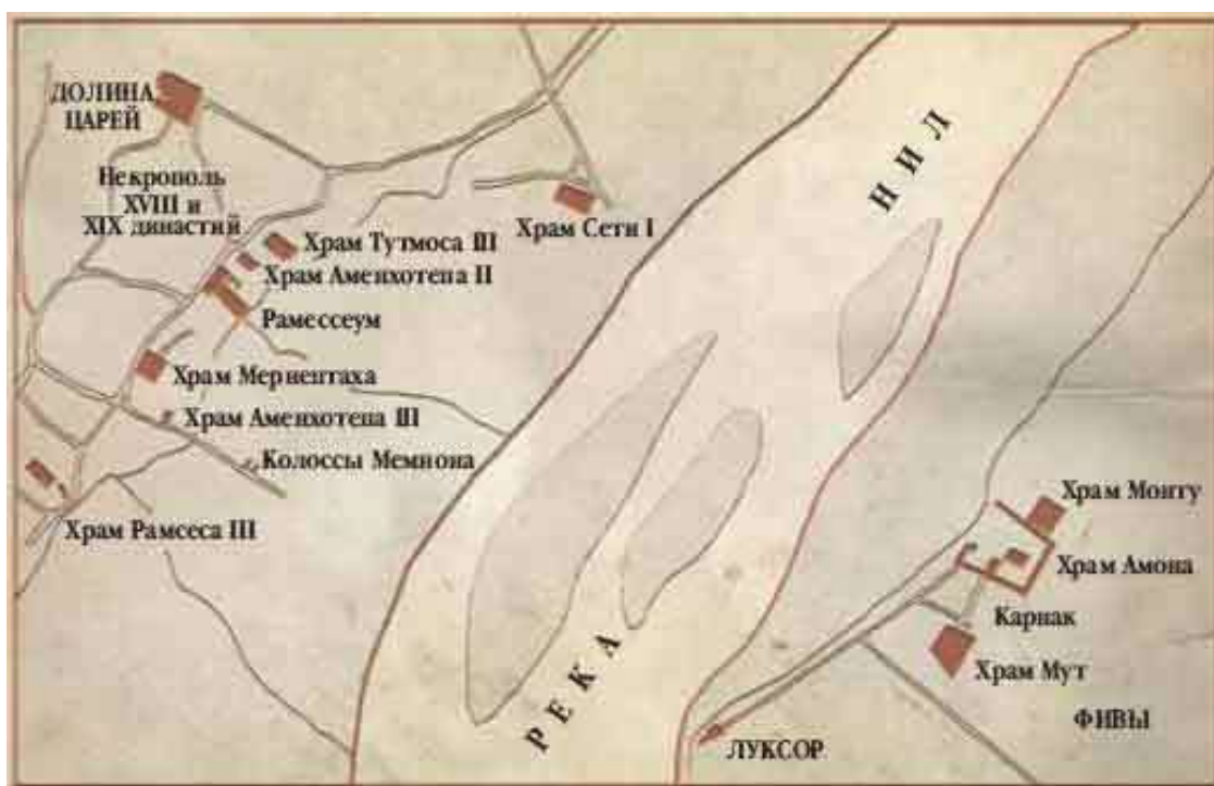
Карта древних Фив с указанием ныне существующих памятников

И из этой тайны мы взяли лишь малую часть – древний город, который греки называли Стувратными Фивами , чтобы отличать его от другого города – своих собственных Семивратных Фив.