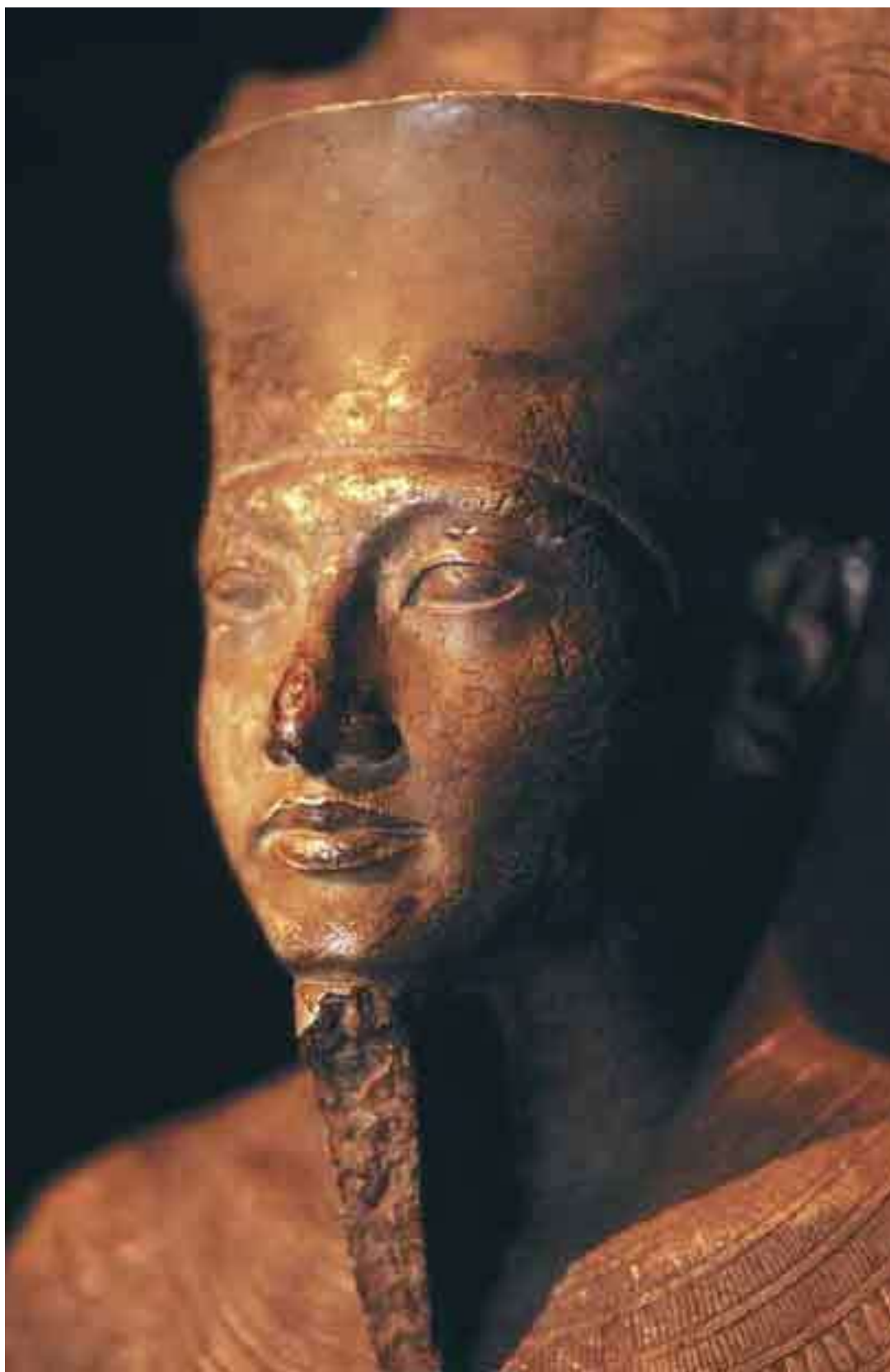
Скульптура Тутанхамона в образе бога Амона. XVIII династия. Луксор, Музей египетского искусства

XIX династию представляли Сети I, Рамсес II и Мернептах. Сети I перестроил верхнюю часть инициатического святилища в Абидосе, считавшегося могилой Осириса, восстановил