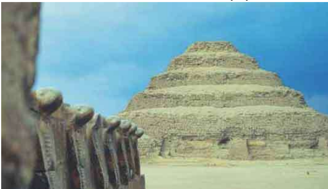
Вид на пирамиду фараона Джосера. III династия. Саккара

Ключевая фигура первой династии – Менес, который, как сообщает, опираясь на достоверные источники, Геродот, был великим царем. Среди его чудесных деяний – основание Мемфиса. Менеса также называют Нармером и с ним связывают знаменитую каменную палетку (плиту), которая, предположительно, имела церемониальное назначение. Этот период называют еще Тинисской эпохой, по имени не найденного до сих пор города Тинис.