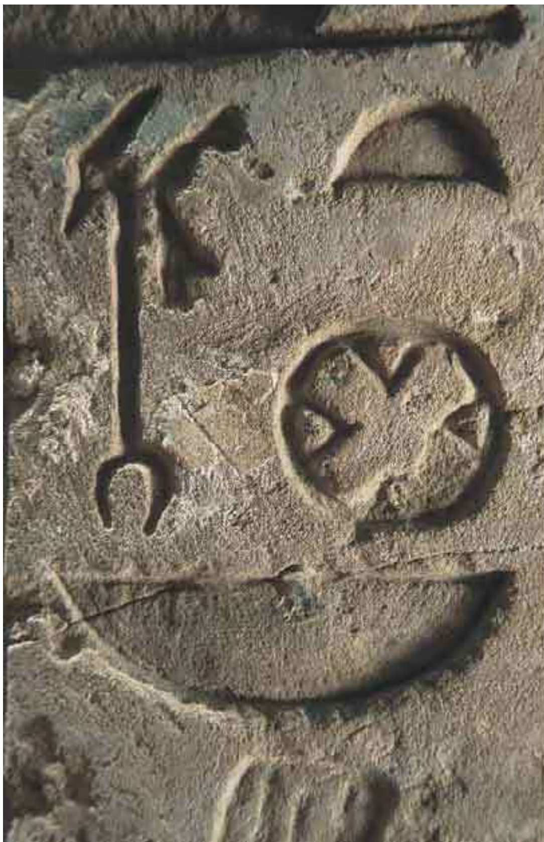
Иероглифическое написание названия города Уасет (Фивы). Храм Амона в Карнаке

Некоторые современные авторы считают, что столь большую площадь Фивы могли иметь за счет Города Мертвых , расположенного на западном берегу Нила. Но особенности долины у подножия Западной горы и полное отсутствие остатков стен не позволяют ручаться за досто-