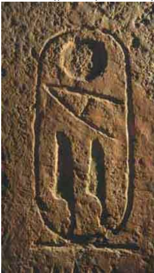
Картуш с изображением второго коронационного имени фараона Пепи I – «Мерира», то есть «Возлюбленный Ра». VI династия. Мастаба Кара

К первой из этих династий принадлежали Ментухотепы, а ко второй – Аменемхеты и Сенусерты. Древние Фивы становятся священной столицей царства. Мемфис приходит в упадок и разрушается. В это время расцветают керамика и металлургия, развивается производство, однако не появляется ни одного архитектурного шедевра, сравнимого с Великой пирамидой. В папирусах и надписях часто упоминается блестящее прошлое, возможно, при этом имеются в виду первые династии или другие, о которых здесь не говорится.