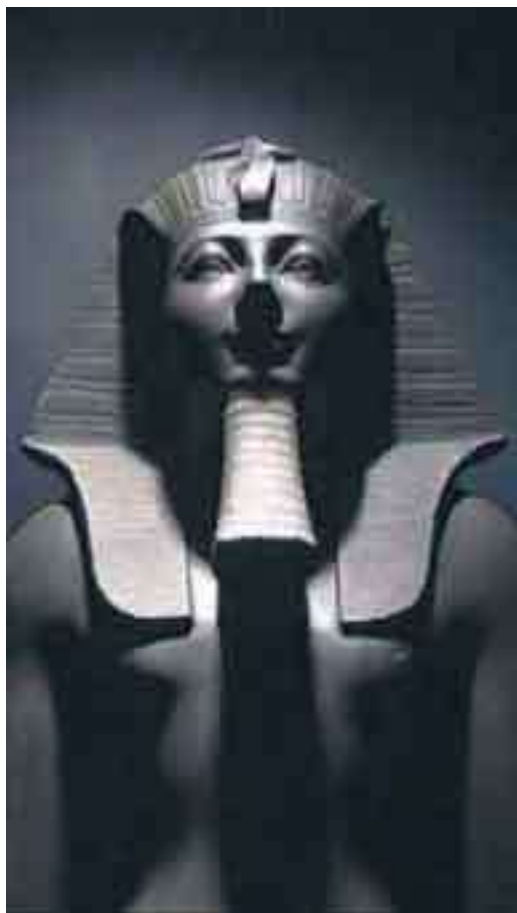
Скульптура Тутмоса III. XVIII династия. Луксор, Музей египетского искусства

Об этом смутном времени сохранилось немного сведений. XIII династию представляли Себекхотепы и Неферхотепы. Правители XIV династии неизвестны. Времена правления XV и XVI династий отмечены частыми нашествиями гиксосов, или «варваров», которые были ассимилированы египетской культурой, что видно по грубым геометризованным формам скарабеев, создававшихся в тот период из керамики и камня. До сих пор неясно, почему гиксосы покинули Египет. Эти люди были настолько ужасными, говорится в некоторых папирусах, что даже после их ухода во дворцах сами собой поднимались каменные плиты, по которым они ступали.