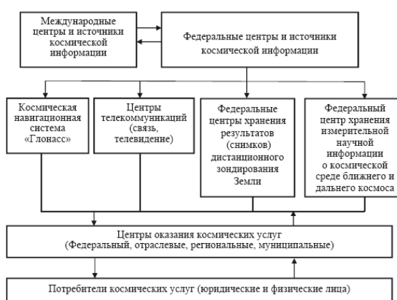
Рисунок 1.2.2 – Федеральные центры и источники космической информации

Наземные центры управления и сбора информации являются ближайшими, своего рода, сподвижниками сферы оказания космических услуг. Вся информация, в частности, о космических съемках собирается в информационных базах данных. В России, например, – это научный Госцентр «Природа» или Научный центр оперативного мониторинга Земли. На рисунке 1.2.2 приведена совокупность организаций и систем, которые аккумулируют, хранят космическую информацию и выдают ее по запросу центров оказания космических услуг различных уровней иерархии, в том числе и с предварительной обработкой информации при необходимости.