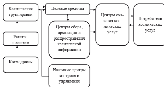
Рисунок 1.2.1 – Элементы инфраструктуры сферы космических услуг

Космические аппараты имеют чрезвычайно широкий спектр как по назначению и функциональным возможностям, так и по габаритно-массовым характеристикам. Среди космических аппаратов можно выделить: наноскопические аппараты (масса до 1 кг); малые (масса до 500 кг); средние (масса 1–2 т); тяжелые (масса 3–6 т и более). Отдельно стоит вопрос о космических аппаратах, направляемых к Луне или к другим небесным телам в научных целях. Вес их может достигать десятков и даже сотен тонн в зависимости от назначения.