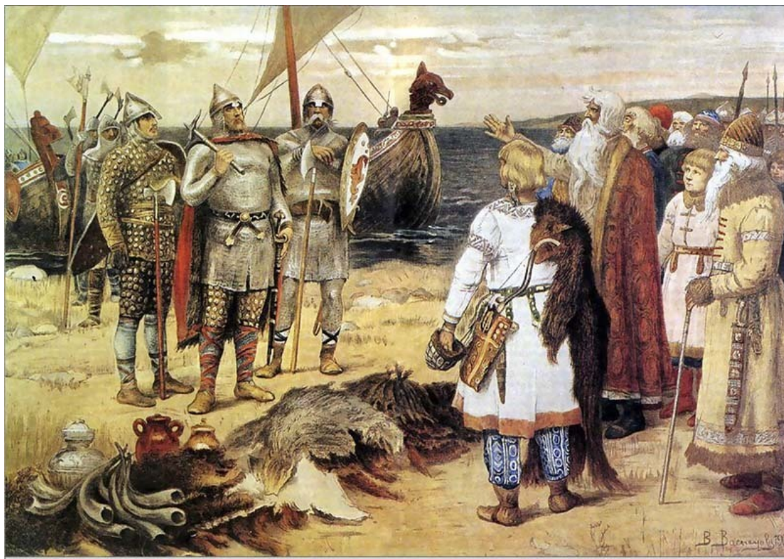
«Прибытие Рюрика в Ладогу». Васнецов В. М. XIX в.

Рюрик умер в 879 г., не оставив потомства. Но есть версия, что у него был малолетний сын, Игорь . На протяжении следующих семи веков правители России выводили свою родословную по прямой мужской линии от Игоря и – считая Игоря сыном Рюрика – называли себя Рюриковичами.