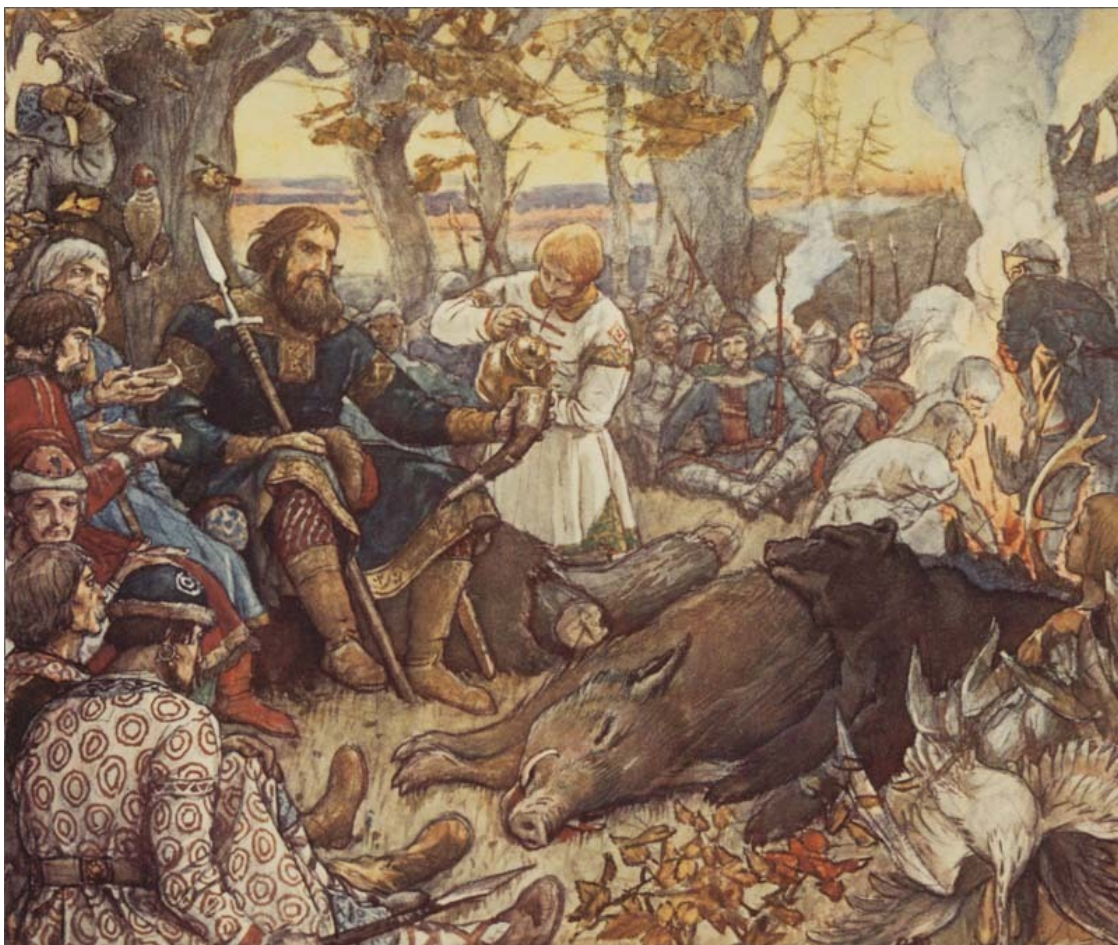
«Отдых великого князя Владимира Мономаха после охоты». В. М. Васнецов. 1895 г.

Владимир и Святополк II действовали совместно против половцев, Олег отказался им помогать. Не явился Олег и на созванный великим князем съезд удельных князей. Тогда войско великого князя изгнало Олега из Чернигова, тот ушёл в Муром, убив правившего там сына Владимира Мономаха, Изяслава. В 1097 г. все князья всё же собрались вместе, наметив общий план борьбы против половцев. Но в тот же год кровавые междоусобицы возобновились.