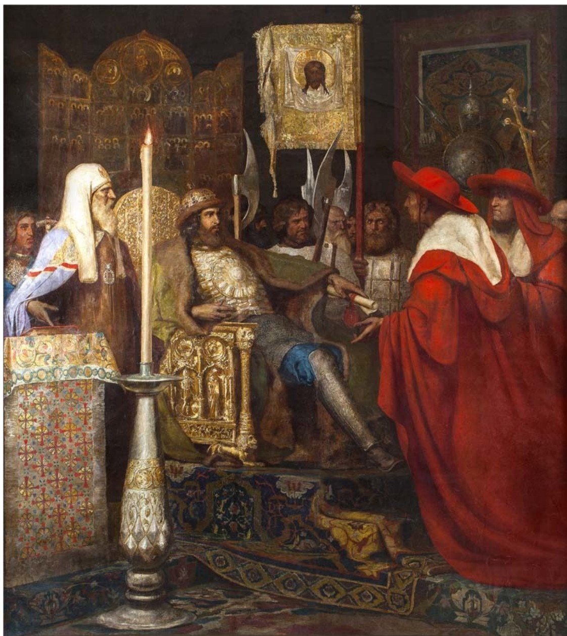
«Князь Александр Невский принимает папских легатов». Г. И. Семирадский. 1876 г.

Быть великим князем в стране, завоёванной иностранцами, нелегко. Однажды монголы решили взимать дань с населения Новгорода, который, как мы помним, не был ими завоёван. В Новгород прибыли баскаки (сборщики дани) и пошли по домам, так как дань была объявлена подушной: каждый человек, проживавший в доме (независимо от возраста и размера имущества) должен был платить одинаковых размеров дань. Дань не платили лишь те, кто проживал за воротами храма – в церкви или в монастыре. Новгородцы возмутились, некоторых баскаков поубивали, а остальные помчались в столичный город Владимир к великому князю Александру Ярославовичу.