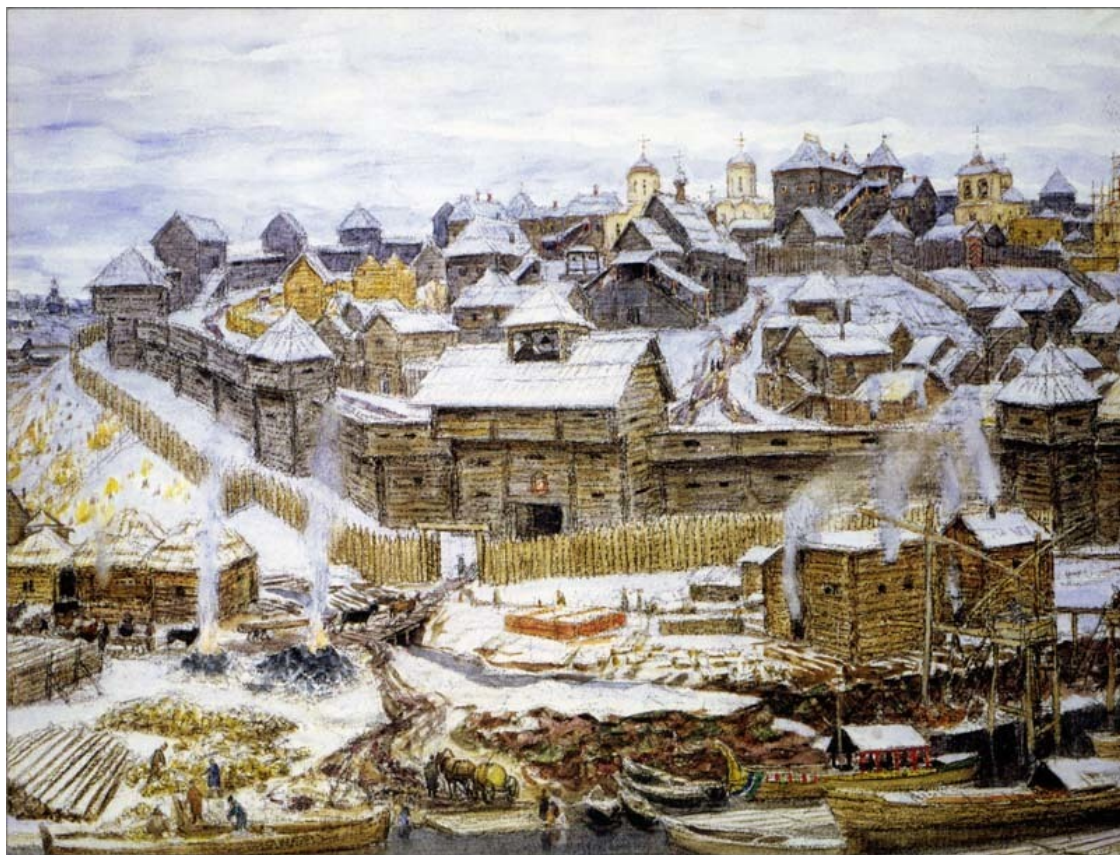
«Кремль при Иване Калите». А. М. Васнецов. XIX в.

Между тем в Твери происходили следующие драматические события. Однажды в этот город, когда там находился Александр Михайлович, приехал мурза (родственник хана), Шевкал. Кто-то пустил слух, что монголы, убив тверских князей Михаила и Дмитрия, теперь-де намерены убить и Александра. Александр испугался и велел сжечь дом, где остановился мурза. Тот сгорел заживо вместе со своей охраной. Тверичи сгоряча перебили всех находящихся в городе монголов – купцов, баскаков и др.