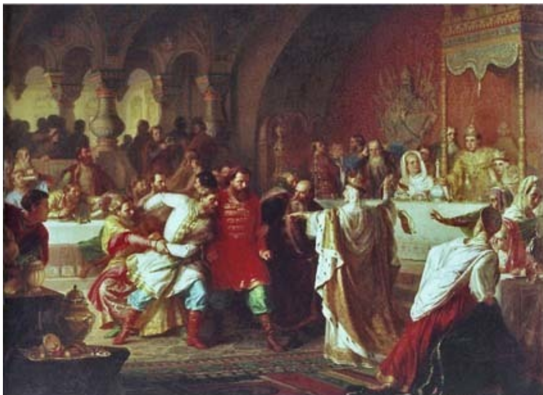
«Великая княгиня София Витовтовна на свадьбе великого князя Василия Тёмного». Карл Гун. 1861 г.

От Софьи Иван III узнал, что по византийским обычаям правитель недосыгаем для подданных. За покушение на жизнь правителя или даже за бранное слово в его адрес должно следовать наказание – вплоть до смертной казни. Византийские порядки (пышность, показное величие и, к сожалению, интриги) стали постепенно входить в быт Московского княжества. Иван III вскоре стал считать себя преемником Византийской Империи, на государственной печати появился двуглавый орёл – как в Византии. Старший сын Софьи Палеолог, будущий великий князь Василий III , наслушавшись с детских лет рассказов матери об истории Византии (в древности называвшейся Восточной Римской Империей), произнёс знаменитую фразу: «Москва – третий Рим, а четвёртому Риму не бывать».