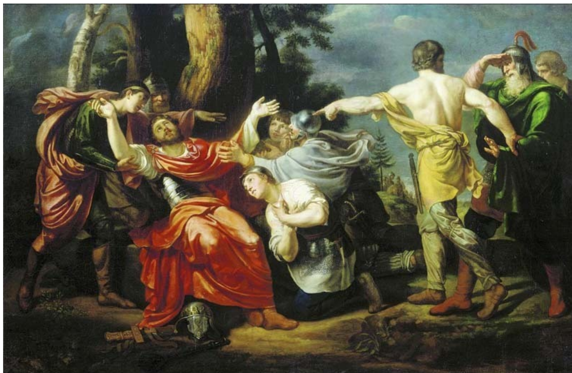
«Дмитрий Донской на Куликовом поле». О. А. Кипренский. 1805 г.

Теперь в Орду поехал (с богатыми подарками) московский князь. Новый хан, Мамай, выдал ярлык ему. Через 3 года Дмитрий Иванович со своим войском подошёл к Твери. Он пять недель осаждал город. Михаил не соглашался заключить мир, по условиям которого он был бы должен подчиняться во всём московскому князю.