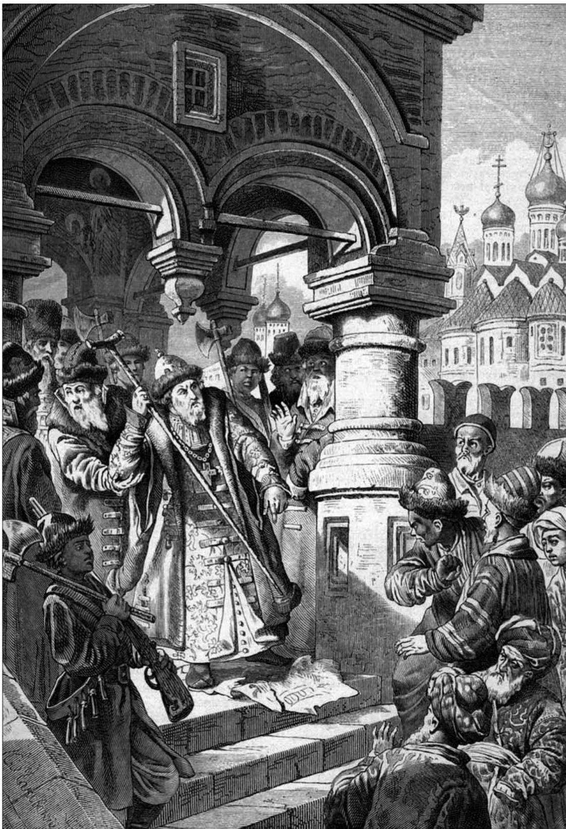
«Иоанн III и татарские послы». К. Е. Маковский. 1870 г.