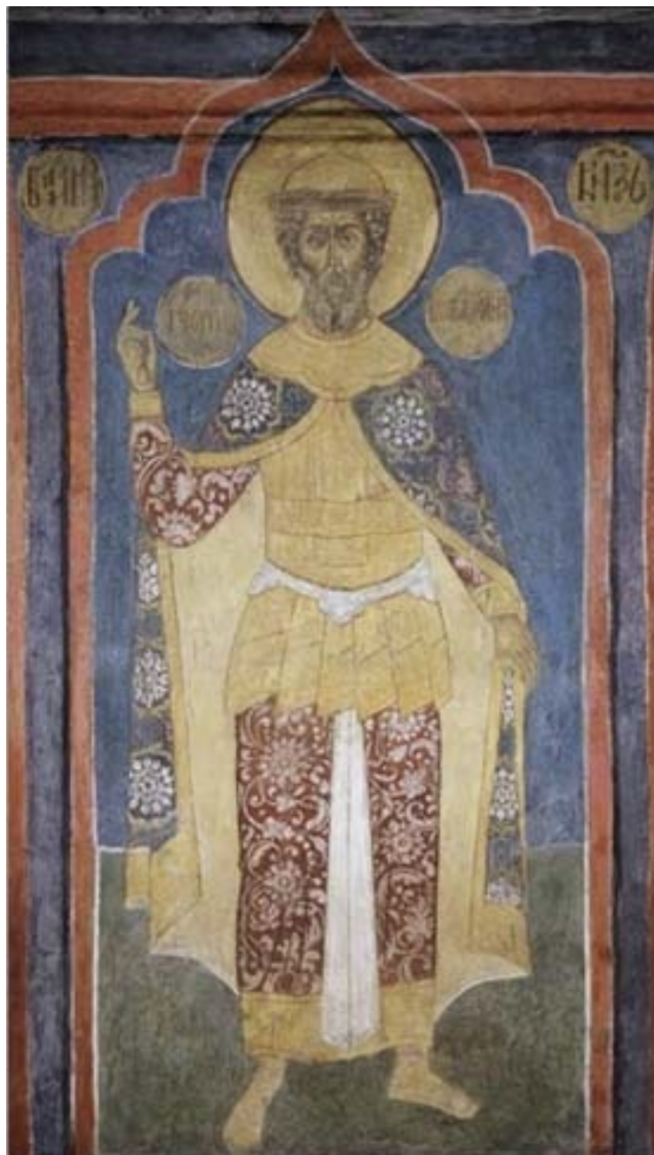
Юрий Всеволодович. Фреска в Архангель- ском соборе Кремля

Через 13 лет огромное (300 тысяч всадников) монгольское войско опять вторглось на русские земли. Этой ордой руководил внук Чингисхана, Батый; помощником у него был участник битвы на Калке, Субедей. Первой подверглась удару Рязань. Рязанским князьям взялись помогать князья Коломенский, Пронский и Муромский. Великий князь Владимирский и здесь отказал в помощи.