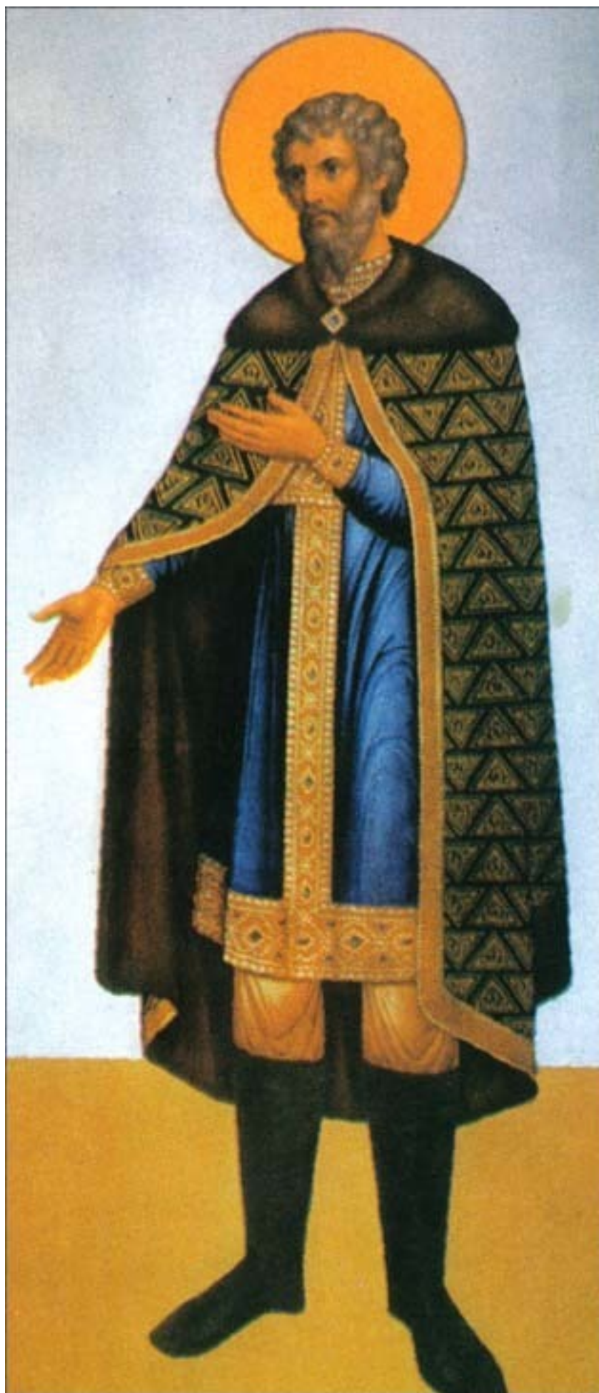
Ярослав I Мудрый.