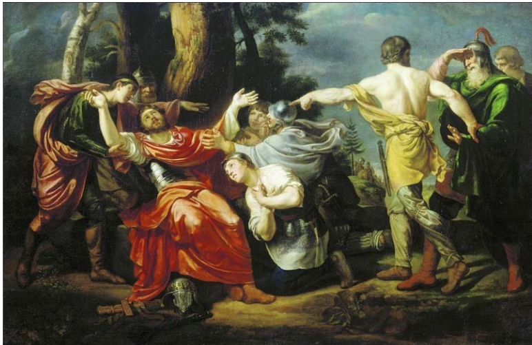
«Дмитрий Донской на Куликовом поле». О. А. Кипренский. 1805 г.

Теперь в Орду поехал (с богатыми подарками) московский князь. Новый хан, Мамай, выдал ярлык ему. Через 3 года Дмитрий Иванович со своим войском подошёл к Твери. Он пять недель осаждал город. Михаил не соглашался заключить мир, по условиям которого он был бы должен подчиняться во всём московскому князю.