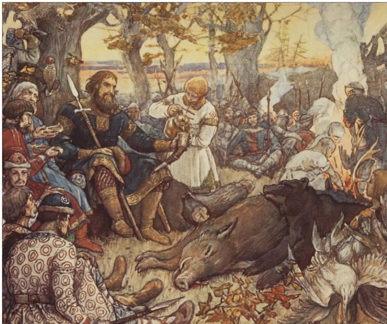
«Отдых великого князя Владимира Мономаха после охоты». В. М. Васнецов. 1895 г.

Владимир и Святополк II действовали совместно против половцев, Олег отказался им помогать. Не явился Олег и на созванный великим князем съезд удельных князей. Тогда войско великого князя изгнало Олега из Чернигова, тот ушёл в Муром, убив правившего там сына Владимира Мономаха, Изяслава. В 1097 г. все князья всё же собрались вместе, на-