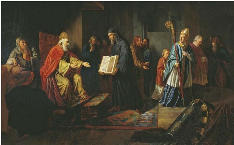
«Великий князь Владимир избирает религию». И. Эггинк. 1822 г.

В летописи отмечается, что деревянную статую Перуна (ещё недавно установленную Владимиром) сняли с пьедестала, привязали к хвосту лошади и избили плетью. Потом униженного и избитого идола отвязали от хвоста лошади и сбросили с высокого правого берега Днепра в воды реки. Были выделены специальные дружинники, которые сопровождали статую вплоть до порогов (около 550 км), отталкивая её палками от берега, дабы местное население – язычники не могло вытащить идола назад, на берег.