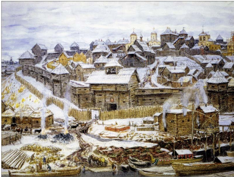
«Кремль при Иване Калите». А. М. Васнецов. XIX в.

Между тем в Твери происходили следующие драматические события. Однажды в этот город, когда там находился Александр Михайлович, приехал мурза (родственник хана), Шевкал. Кто-то пустил слух, что монголы, убив тверских князей Михаила и Дмитрия, теперь-де намерены убить и Александра. Александр испугался и велел сжечь дом, где остановился мурза. Тот сгорел заживо вместе со своей охраной. Тверичи сгоряча перебили всех находящихся в городе