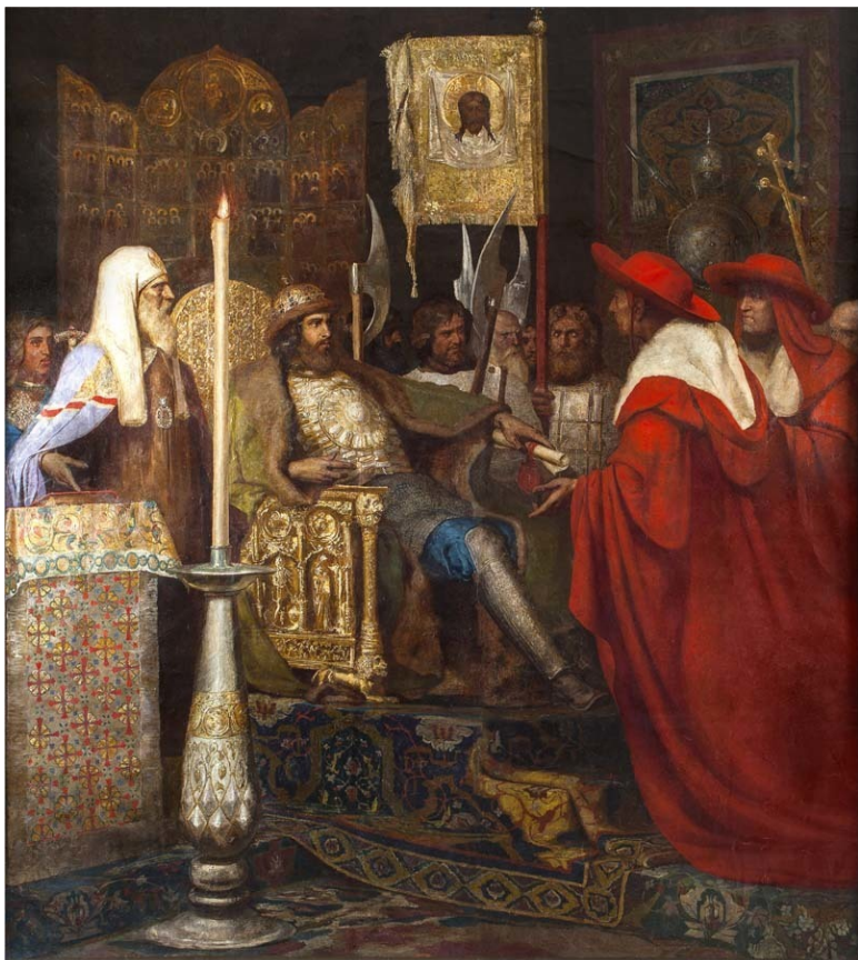
«Князь Александр Невский принимает папских легатов». Г. И. Семирадский. 1876 г.