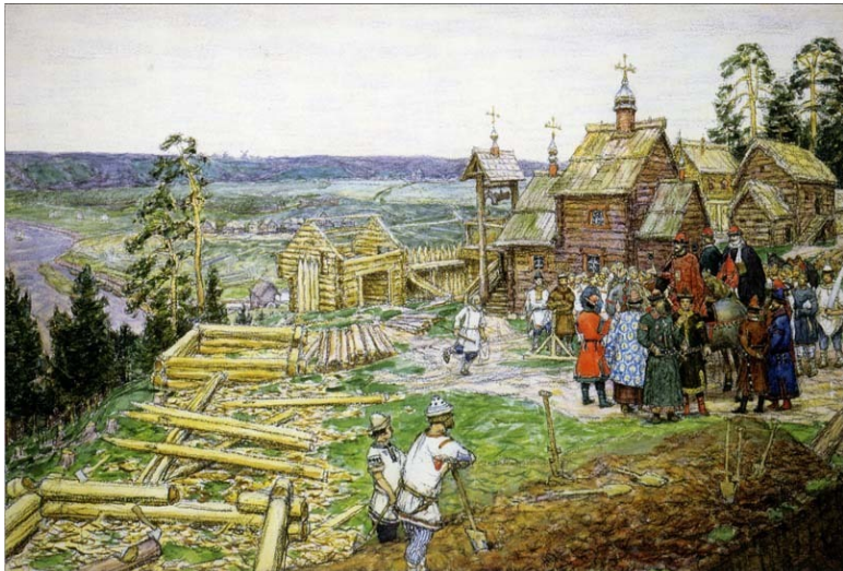
«Основание Москвы. Постройка первых стен Кремля Юрием Долгоруким в 1156 году». А. М. Васнецов. 1917 г.

А князь Юрий Долгорукий всё-таки воссел на великокняжеский престол в Киеве, это произошло 20 марта 1155 г. Через два года, 15 мая 1157 г., он неожиданно умер, как полагают, от отравления (во время трапезы). Жители Киева, узнав о кончине князя, ворвались в княжеский дом, разграбили его, перебили всех находящихся там людей. Пострадали суздальские купцы, торговавшие в Киеве. По различным городам прокатилась волна грабежей и убийств. Карамзин пишет, что князь, похоже, не пользовался любовью населе-