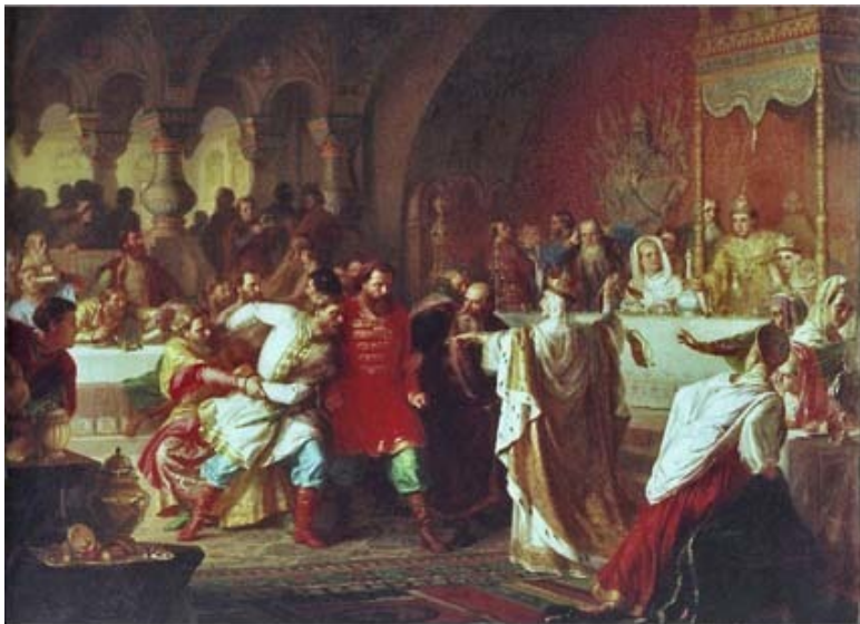
«Великая княгиня Софья Витовтовна на свадьбе великого князя Василия Тёмного». Карл Гун. 1861 г.

От Софьи Иван III узнал, что по византийским обычаям правитель недосыгаем для подданных. За покушение на жизнь правителя или даже за бранное слово в его адрес должно следовать наказание – вплоть до смертной казни. Византийские порядки (пышность, показное величие и, к со-