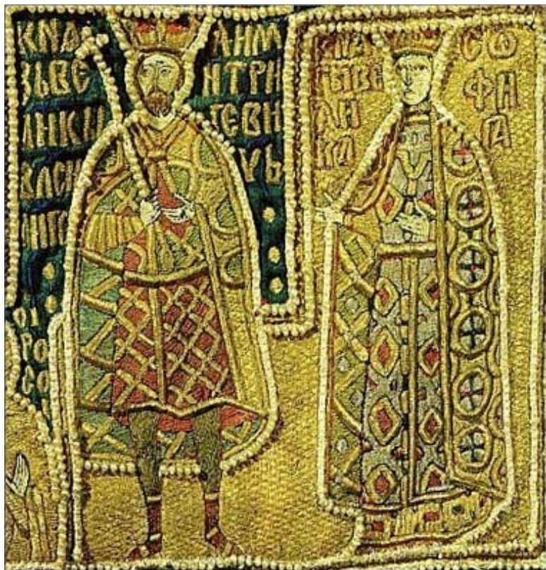
Василий Дмитриевич и Софья Витовтовна (шитъе на саккосе митрополита Фотия). 1414–1417 гг.