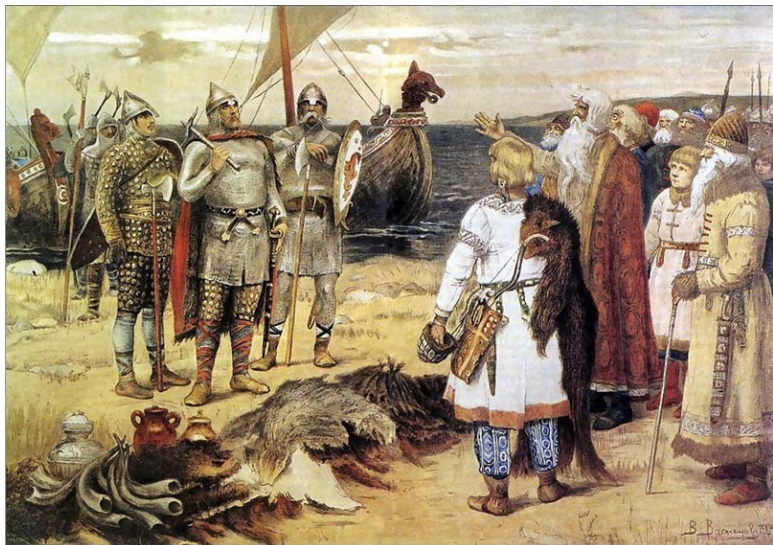
«Прибытие Рюрика в Ладугу». Васнецов В. М. XIX в.

Рюрик – личность полулегендарная. Неизвестно точно, из какой страны прибыл этот иностранец (варяг). С ним, очевидно, прибыло ещё несколько наёмников-воинов, которые становились где – начальниками дружин, а где (в более мелких племенных союзах) – князьями. После их смерти власть переходила к Рюрику, так, вскоре он стал властвовать в Белоозере и в Изборске. В Новгороде Рюрик теперь сделался наёмным князем, пределы своего княжества он расширил, захватив Полоцк, Ростов и Муром.