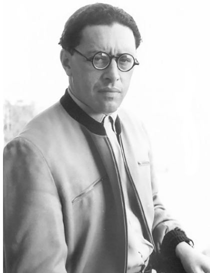
Юрий Трифонов. Москва, начало 1950-х гг.