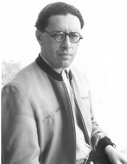
Юрий Трифонов. Москва, начало 1950-х гг.