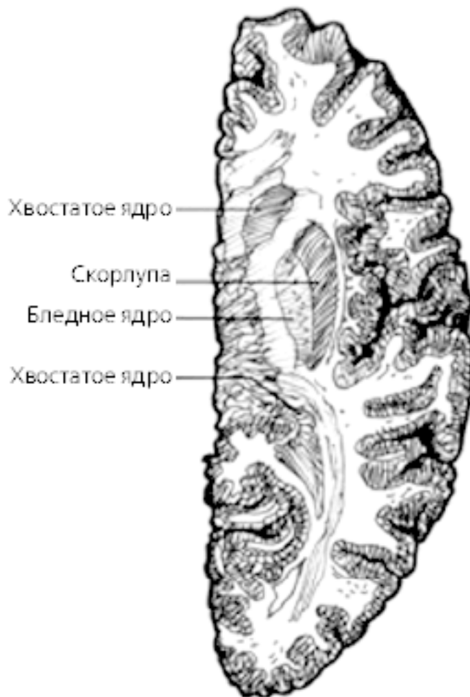
Срез головного мозга человека

Фишер и Браун установили, что с романтической любовью в головном мозге связано именно хвостатое ядро. Они обнаружили, что длительная привязанность концентрируется во фронтальной части и основании мозга, в вентральной скорлупе и бледном ядре. Чувства, связанные со страстью и сексуальным возбуждением, воздействуют на другие области, преимущественно расположенные в левом полушарии мозга. Это очень важное исследование снимает покров тайны с любви и позволяет нам относиться к этому чувству более объективно.