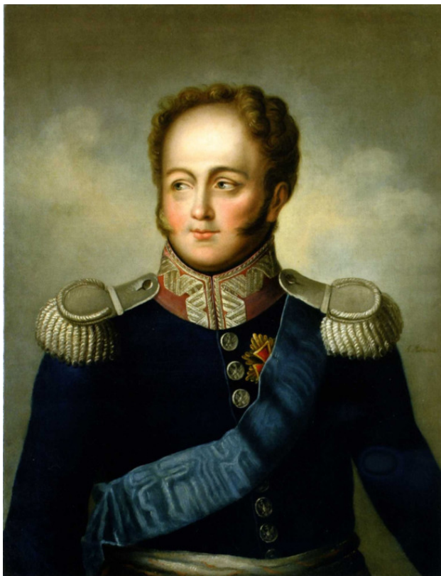
Александр I Павлович