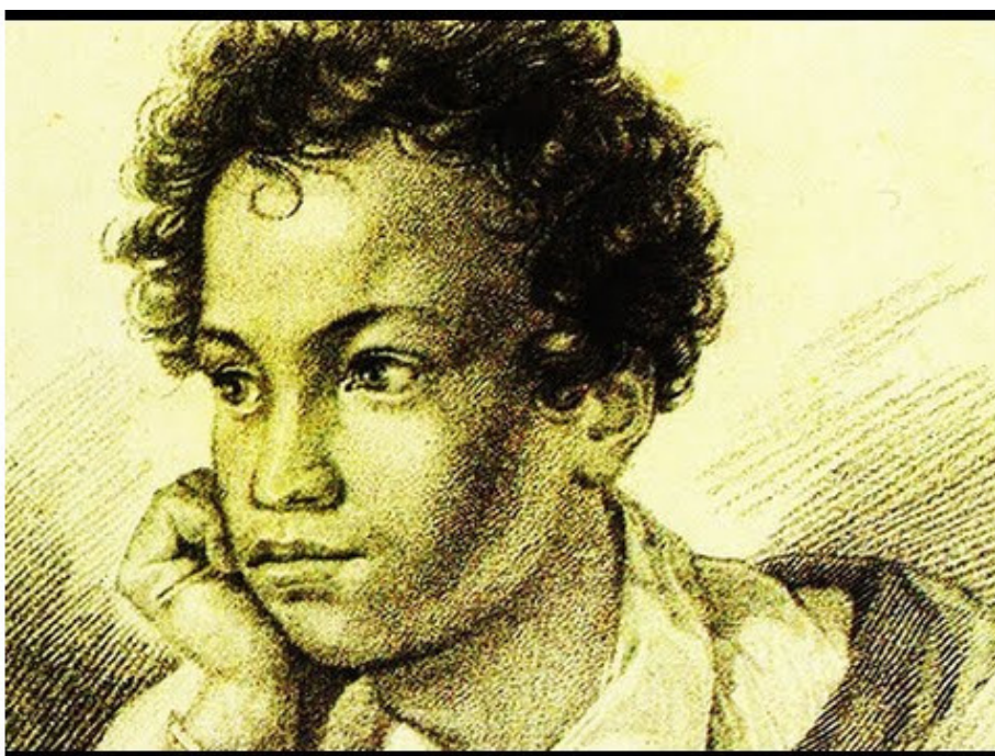
Пушкин в детстве

Но – до этого пока далеко. Пока маленький Саша – круглый упитанный ребенок лет семи-восьми – играет со сверстниками во дворе родовой усадьбы в Михайловском, близ Звенигорода. Погода стоит ясная, теплая, разгар лета. Конец июня всегда здесь знаменит своею рыбалкою – и маленький Саша, и его дед, Осип Абрамович любят половить осетров да лещей в здешней речушке. Лето Саша обычно проводит здесь, в имении деда и бабки. Дед уже весьма преклонных лет, но еще бодрячком – чуть позже выяснится, что этот год станет последним в его жизни. А вот бабка еще и коня на скаку остановит, и в горящую избу войдет, и замечательные кошерные кнедлики еще приготовит.