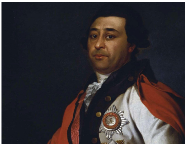
Осип Абрамович Ганнибал

После долгих приветствий государь говорил в столовой с дедом (Саша слышал это краем уха, стоя с той стороны двери, ибо страсть к подслушиванию давно была ему свойственна, с раннего детства):