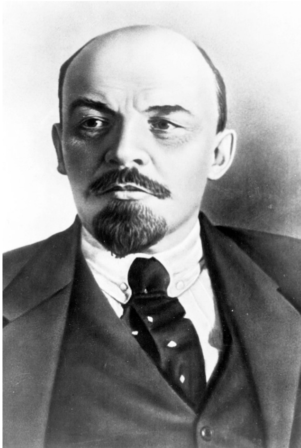
Владимир Ильич Ленин

Пройдет много лет, Ленина уже не будет в живых, и Сталин, не имевший ни малейшего понятия об этом разговоре Ильича с немецким военным посланником, будет лишь в самых общих чертах знать о чудесной роли эфиопской валюты в новейшей русской истории. Как