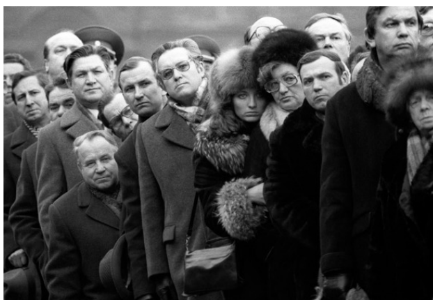
Похороны Брежнева. Провожали эпоху

Я не знаю, что за дурость! Что за прыть! Лишь бы где-нибудь кого-нибудь зарыть! Лишь бы где-нибудь кого-нибудь зарыть! Ни носков теперь, ни сахара, ни клизм... А какой был развитой социализм!..