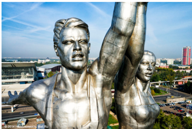
Рабочий и колхозница. Фрагмент. Скульптор В. Мухоморова

Филологи определили, что разговорное выражение «ни к селу, ни к городу» имеет неодобрительную оценку. Означает сказанное или сделанное некстати, не к месту, невпопад .