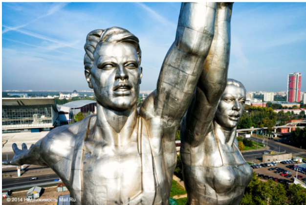
Рабочий и колхозница. Фрагмент. Скульптор В. Мухомин

Филологи определили, что разговорное выражение « ни к селу, ни к городу » имеет неодобрительную оценку. Означает сказанное или сделанное некстати, не к месту, невпопад .