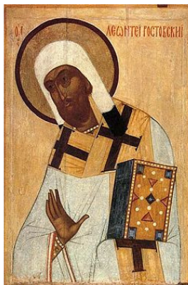
Леонтий Ростовский (икона середины XVI века)

Как о жизни, так и о смерти сведения разноречивы: по одним источникам – он скончался в мире (согласно «Жития Леонтия Ростовского» ), по другим – был убит толпою язычников (согласно «Киевско-Печерскому Патерику» ); и даты смерти епископа Леонтия указываются разные – от 1070 года до 1073 года.