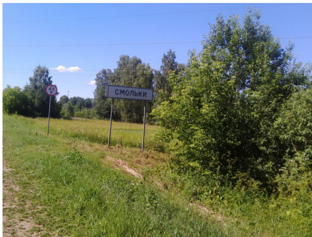
Указатель д. Смольки (Смольково)

ская, Глуховка, Горенки, Горенское, Гурьево, Гусево Большое (Чистое), Гусево Речное, Двойниково (Дойкино), Долганиха, Дудкино, Желтиково, Каверзино, Кожухово, Королево, Круглое, Кузнецово, Кулаково, Ломки, Лыкошино, Лубянки Большие, Лубянки Малые, Лямино, Нечаиха, Новочистное, Оленино. Орешки, Ошурково, Паново, Погорелка, Поповка, Прокофьево, Санниково, Сватково, Сидорово Чистное, Сорвачево, Степеиха, Ульяниха, Устимиha, Швецово, Шишулино. Однако в ревизских сказках по Смольковскому приказу встречаются и другие деревни.