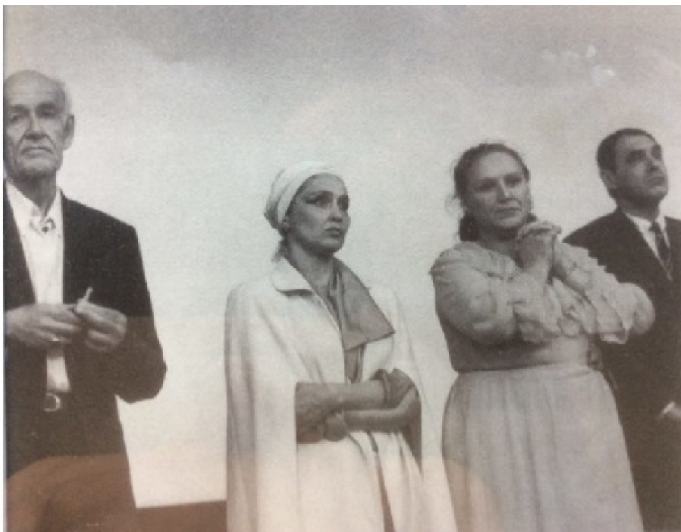
Начало исторической пресс-конференции после премьеры «Комиссара»