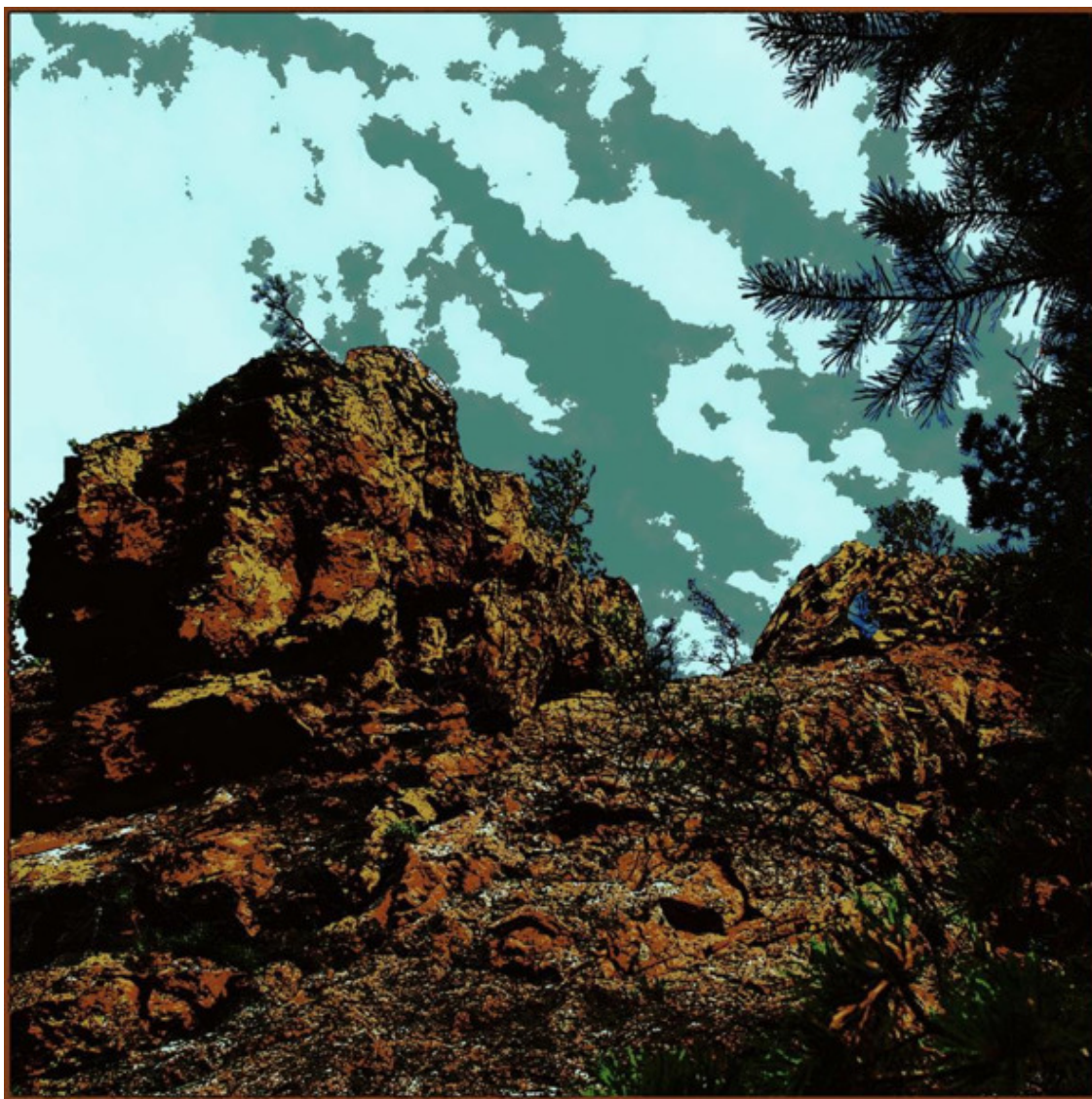
Сумэру. Фотография Юрия Извекова