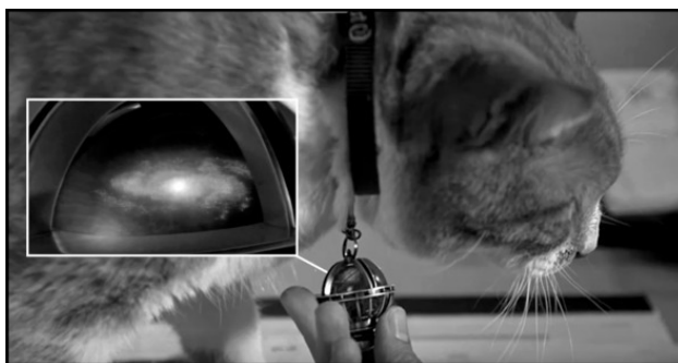
Рис. 2. Отрывок из х/ф «Люди в чёрном». 1997 г.

«Как в человеческом теле каждый орган имеет свою собственную функцию, точно так же и во вселенной каждое из существ имеет особое назначение. Благодаря этому, они не только образуют части вселенной, но и сами по себе являются вселенными, обладающими самобытным значением. Следовательно, все вещи проистекают из единого принципа, выполняют каждая свое назначение и находятся во взаимных воздействиях; Личность не есть индивидуальность: индивидуальность есть целостный разрез космоса, самобытный аспект самосозерцания Бога, личность же есть только самостоятельный элемент частной группы, частного вида или частного множества, индивидуальность есть единство, органически объединяющее все виды множества, личность есть единство, образующее совместно с другими ему подобными органическую множественность». 21