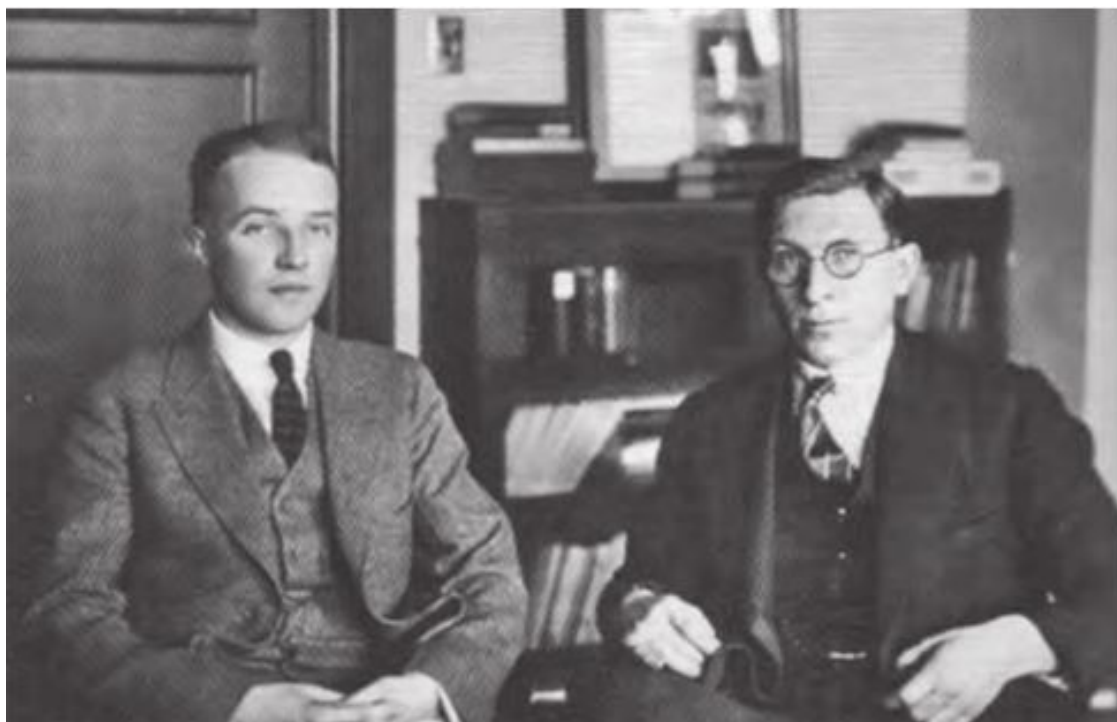
Рис. 4. Фредерик Бантинг (справа) и Чарльз Бест

Такова первая версия, и, ознакомившись с ней, мы можем подумать, что Бантинг был молодым ученым, преуспевающим эндокринологом, практиковавшим в Центральном госпитале Торонто; что были у него отличная лаборатория, мудрый наставник-профессор, вдоволь собак и кроликов для опытов и верный помощник Бест, а также, возможно, другие помощники в ранге простых лаборантов, чтобы кормить собак и выносить их трупы – собак в процессе работы Бантинга погибло несколько десятков.