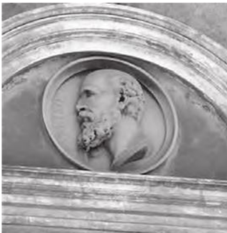
Рис. 2. Аретей Каппадокийский. Даты жизни: ок. 81 г. н. э. – ок. 138 г. н. э.

Первое клиническое описание сахарного диабета дал римский врач Аретеус (он же – Аретей Каппадокийский, рис. 2); он же ввел в медицинскую практику термин «диабет». Больные диабетом 1-го типа сильно худеют, очень много пьют и часто мочатся, жидкость как бы проходит через их тело стремительным потоком, и потому Аретеус (а по некоторым данным – еще ранее него, в 230 г. до н. э. греко-египетский врач Аполлоний Мемфисский) произвел название болезни от греческого слова «diabaino» – «прохожу сквозь».