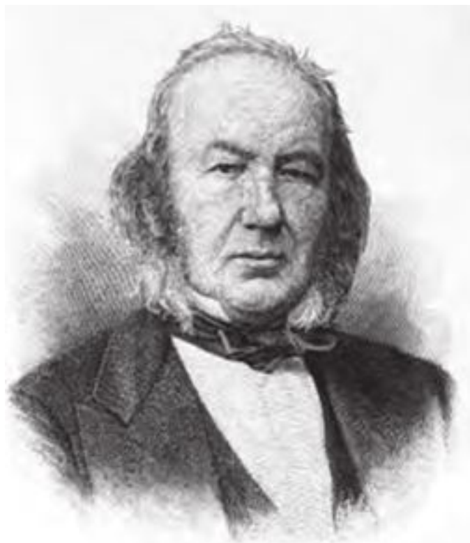
Рис. 3. Клод Бернар

За эту работу, выполненную в 1848 г., Бернар был удостоен высшей премии Французской Академии Наук; кроме того, он стал «дважды академиком»: в 1854 г. – по отделению медицины, и в 1868 г. – по отделению физиологии.