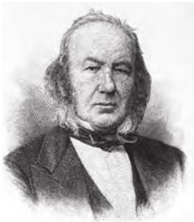
Рис. 3. Клод Бернар

За эту работу, выполненную в 1848 г., Бернар был удостоен высшей премии Французской Академии Наук; кроме того, он стал «дважды академиком»: в 1854 г. – по отделению медицины, и в 1868 г. – по отделению физиологии.