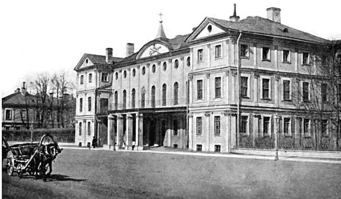
Здание Первого кадетского корпуса в Санкт-Петербурге. Меншиковский дворец на Васильевском острове

По медленности, с каковою производилась сдача дома в Корпусное ведомство, по исправлению и переделке комнат не все кадеты могли поместиться в Корпусе, а жили большею частию поблизости оного в частных домах, нанимая квартиры на собственный счет, что продолжалось до самой зимы 1732 года. Для учебных пособий кадет учреждена Люберасом небольшая библиотека, предпочтительно из латинских книг; для практического учения артиллерии присланы в Корпус две 12-фунтовые пушки, кои были поставлены на набережной перед большим подъездом у нынешней Греко-российской церкви; над фронтоном дома сделан государственный герб; для верховой езды устроен большой рейтбан, а дабы Корпус имел своих музыкантов, прислано в оный несколько малолетних солдатских детей. Для переездов чрез Неву даны Корпусу перевозные суда, и все принадлежавшие к оному получили право проходить безденежно Исаакиевский мост.