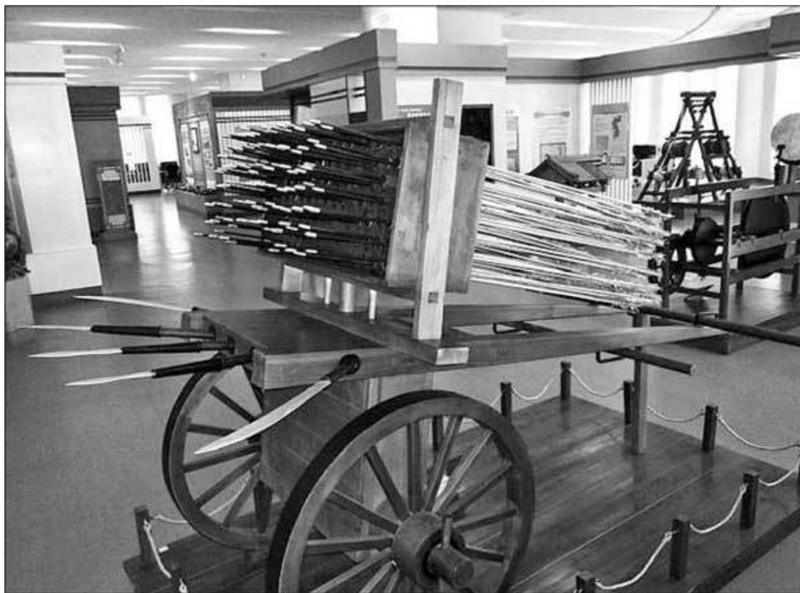
Хвачха – северокорейский боевой ракетомет

Государства Пэкче, Силла и Кая занимают один зал. Однако там много качественных реплик известных памятников, а также модель Соккурама. Зато отдельный зал посвящен государству Бохай.