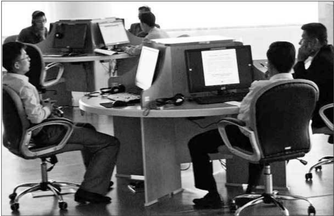
Студенты за работой на компьютерах

У одного из посетителей я видел что-то похожее на открытую страничку в соцсети, и спросил об этом своего гида. Она сказала, что в северокорейском Интранете социальная жизнь есть примерно на уровне ФИДО начала 1990-х. Есть чаты, есть доски объявлений. И вроде бы даже есть своя онлайн-РПГ.