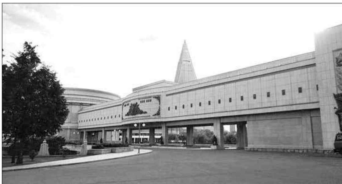
Музей победы в Корейской войне

Правда, нельзя сказать и то, что вклад советской армии в освобождение Кореи вычеркнут полностью. Есть официальный зал интернационалистов, где с одной стороны висят портреты командиров и героев китайских народных добровольцев, включая маршала Пэн Дэхуая и погибшего на этой войне Мао Аньина (сын Мао Цзэдуна), а с другой – советских офицеров и генералов, от Василевского и Мерецкова до Якова Новиченко – того самого, который перехватил брошенную в Ким Ир Сена самодельную бомбу и потерял при этом кисть руки. Портрету Пэна я был приятно удивлен, так как известно, что с Кимом он не ладил, а в 1956 г. возглавлял китайскую делегацию на пресловутых «двух самолетах». То, что ему отдали должное на фоне северокорейской привычки убирать из кадра «неправильные лица», – это хорошо.