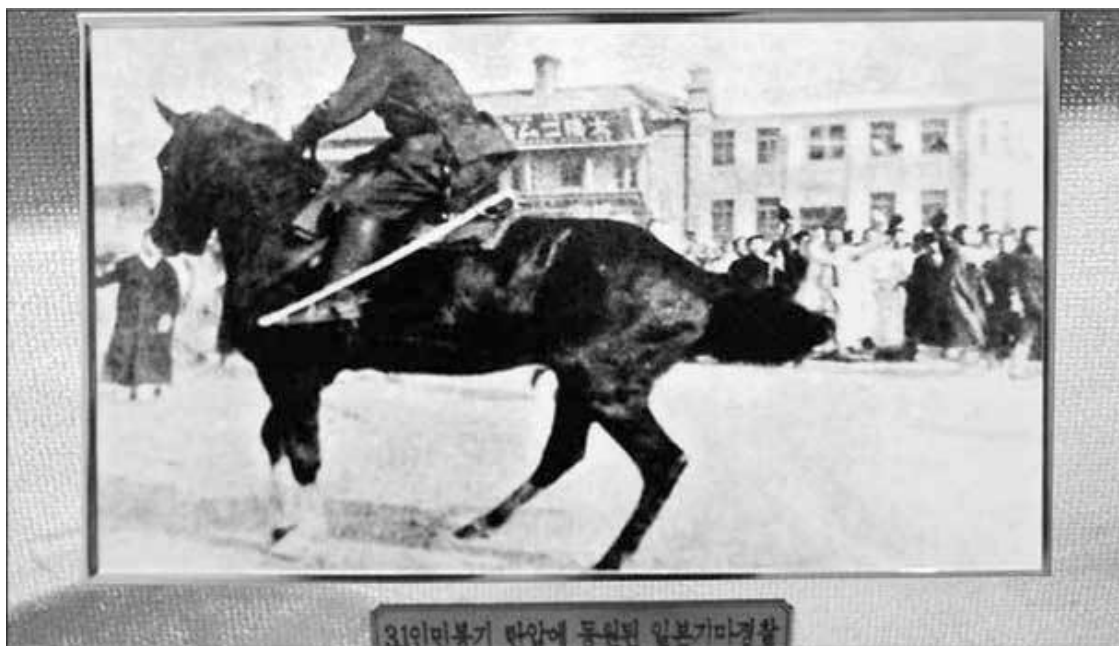
Японская конная полиция подавляет первомагтовское движение

Начинается всё, как обычно, с рассказа об империалистах, которые «тянут лапы к стране», и того, как выглядело сопротивление до того, как в него пришел Ким. Присутствовала пушка, снятая с «Генерала Шермана», стела Тэвонгуна с соответствующей надписью, рассказ о сражении 1871 г., а также опубликованные на японском языке какие-то документы по сэйканрон и портрет Сайго Такамори. Тема потопления американского корабля была раскрыта, как обычно, за исключением того, что американцы требовали большие запасы золота и женьшеня. Информация о Ким Ок Кюне была нейтральной, он назван «руководителем переворота», и приведено как его стандартное фото, так и фото его отрезанной головы, которую специально привезли в страну и вывесили на всеобщее обозрение. Это довольно важно, т. к. в ранних учебниках новой истории в КНДР Ким Ок Кюн позиционировался как реакционный прояпонский элемент, а убитые им представители консерваторов – как патриоты и борцы с иностранным влиянием. Однако затем экспозиция сразу же переходит к соглашению Тафт – Кацура и протекторату, упирая на то, что документ был подписан без прикладывания государственной печати. Среди патриотов упоминается Хон Бом До (правда, без рассказа о его дальнейшей судьбе 29 ), а на стене висит в целом не обрезанная цитата из Тэраути (первый генерал-губернатор Кореи) о том, что корейцы должны принять новый порядок или умереть.