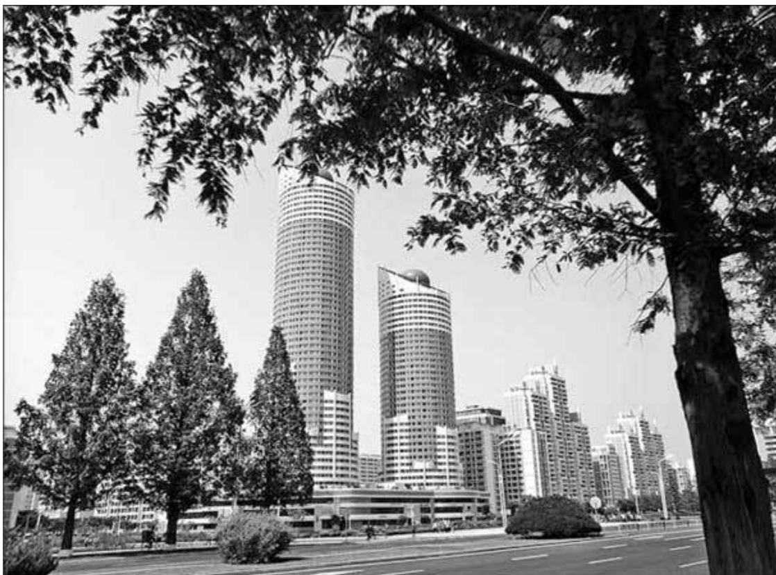
Новый квартал Рёмён

Среди первых попыток проникновения в Корею империализма – «Генерал Шерман» и попытка Опперта разграбить гробницу отца регента Тэвонгуна.