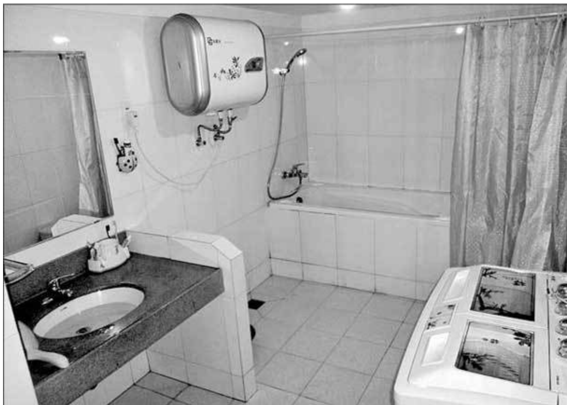
В раковине и ванне видны запасы воды на случай отключений

Правда, квартира, которую нам показали, была всё-таки квартирой «простого советского замминистра». Согласно легенде, глава семьи руководил КБ и получил наградные часы еще от Ким Чен Ира. Сейчас он совмещает работу и преподавание в Политехническом университете им. Ким Чхэка, и потому его нет дома, взрослый сын на учебе, и дома только его жена-домохозяйка, которая принимала гостей. С одной стороны, она была довольно доброжелательной и даже угостила нас кофе, с другой, между ней и присутствовавшим при нашем визите управдомом состоялся диалог категории: «Ну, можно я уже пойду?» – «Нет, еще две делегации должны прийти».