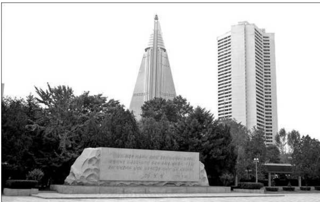
Треугольная гостиница «Рюгён»

Впрочем, сегодня монумент со светящимся факелом перестал считаться «инфернальным символом Пхеньяна». Его место занимает характерный треугольный силуэт гостиницы «Рюгён». При этом я был действительно удивлен тому, что некоторые диванные эксперты по КНДР на полном серьезе полагают это место резиденцией Ким Чен Ына.