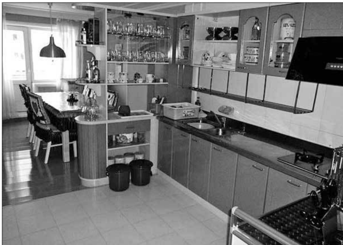
Квартира в квартале Мирэ

Высота потолка – 220 см. 2 туалета. Ванна и раковина заполнены водой, горячая вода из крана шла, но примерно 40–45° и со слабым напором.