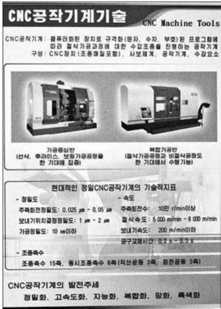
Стенд, посвященный станкам с ЧПУ

ные стенды и, например, специальный медицинский манекен ребенка для отработки навыков первой помощи. Ты ее оказываешь, а датчики показывают, правильно ты это делаешь или нет.