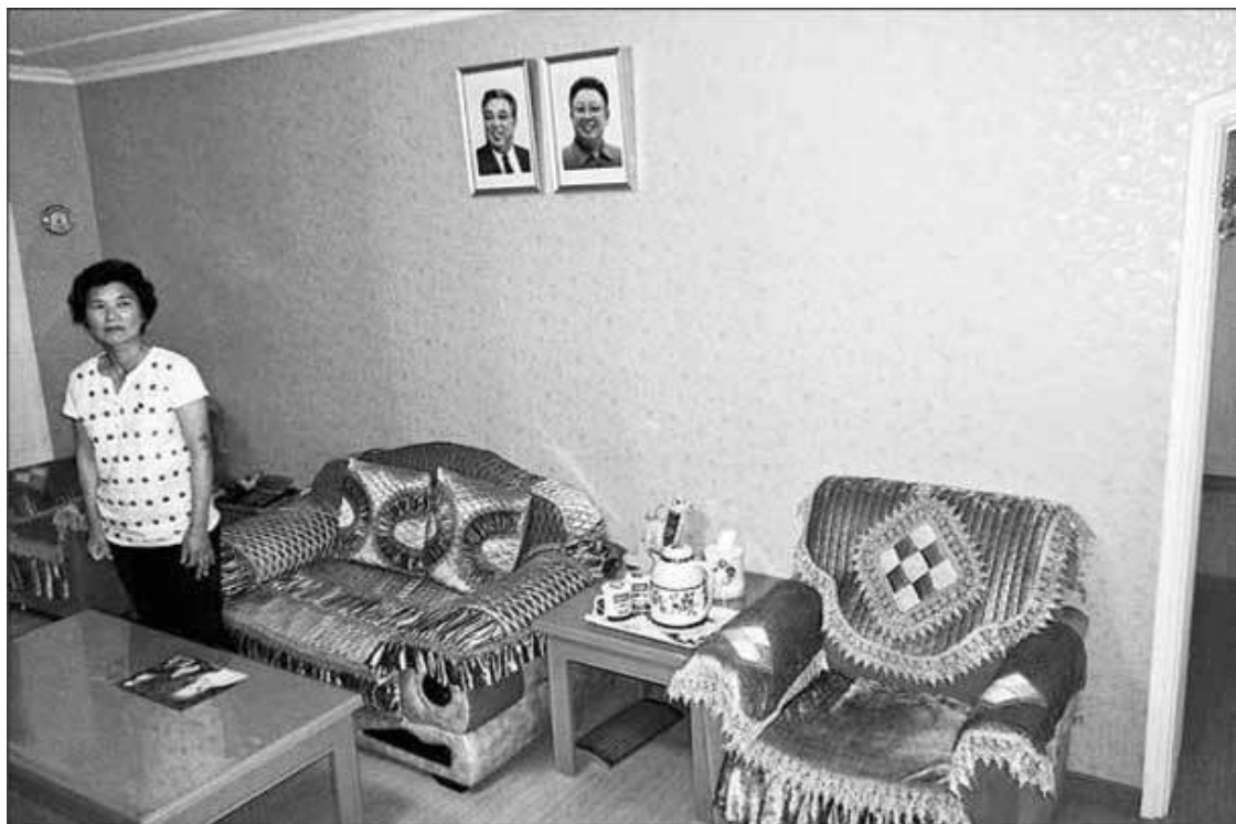
Обязательные портреты вождей на стене