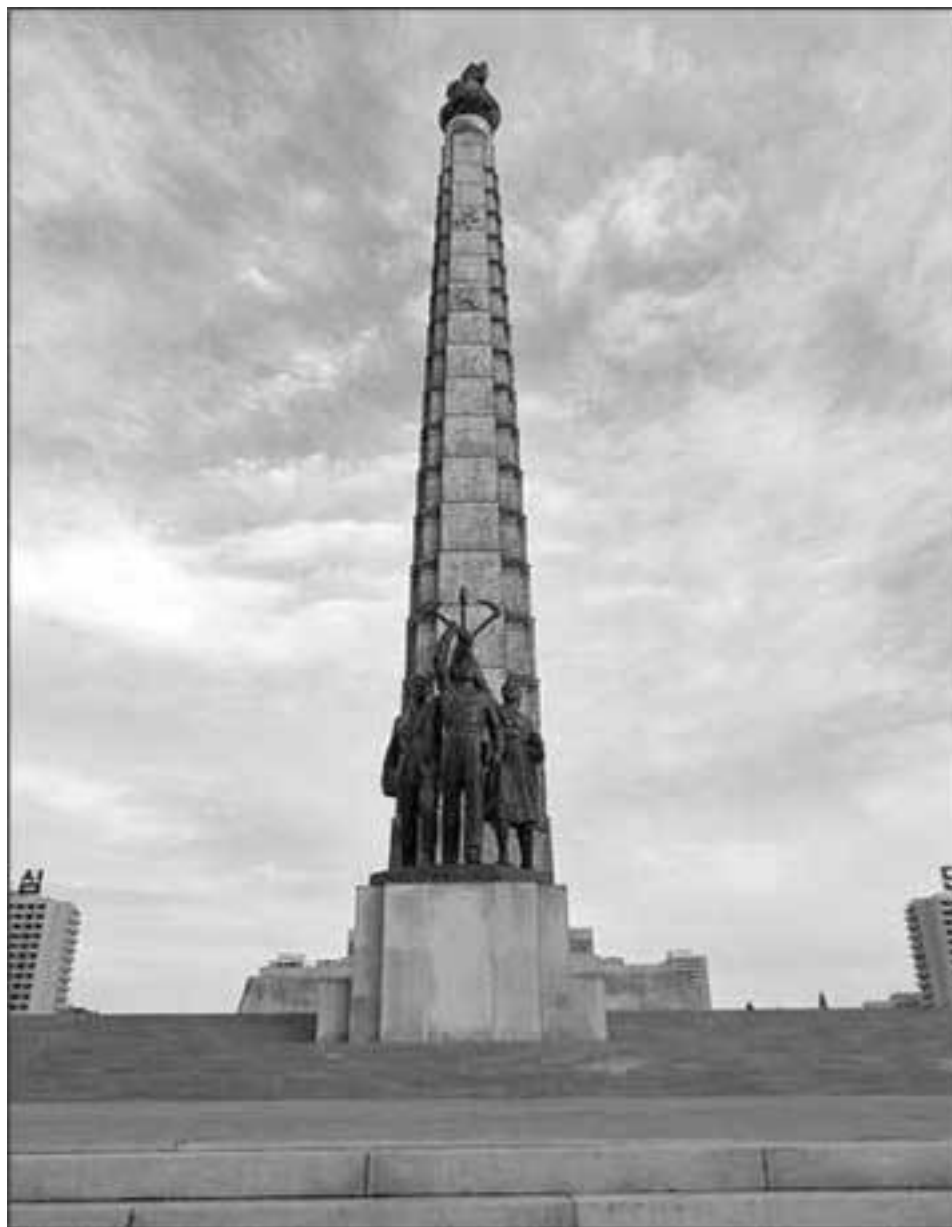
Монумент идей чучхе

С монумента открывается прекрасный вид на Пхеньян, и хорошо видно, насколько город меняется. Очень много новых микрорайонов, построенных как на месте одноэтажной застройки, так и некоторых домов сталинского времени. По сути, сегодня новые районы Пхеньяна напоминают некоторым моим знакомым типичный китайский город-миллионник в соседнем Дунбэе. На мой взгляд, именно оттуда заимствованы типовые 40-этажки, которыми застраиваются китайские города. В таком доме во время пребывания в Тяньцзине жил один из моих знакомых, рассказывая, что иногда лифт приходилось ждать 15 мин. Квартиры достаточно просторные, удобства есть, и я думаю, что северокорейские дома не отличаются от китайских. Вопрос, скорее, в том, какого качества бетон и хватит ли электричества на то, чтобы там нормально работали лифты и подавалась вода.