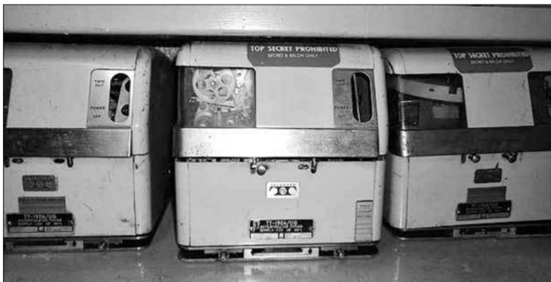
Шпионское оборудование на судне «Пуэбло»

ли весь экипаж, то ли все офицеры казнены. После этого, с одной стороны, сам экипаж решил, что их сливают, а, с другой, северокорейцы опубликовали открытое письмо от имени экипажа и начали угрожать гласным судом, на котором доказательства шпионской деятельности были бы предъявлены всему миру. В результате, на фоне Вьетнамской войны, инцидент с «Пуэбло» позиционируется как будто бы единственный случай, когда США не просто признались в ведении шпионской деятельности, но и официально извинились.