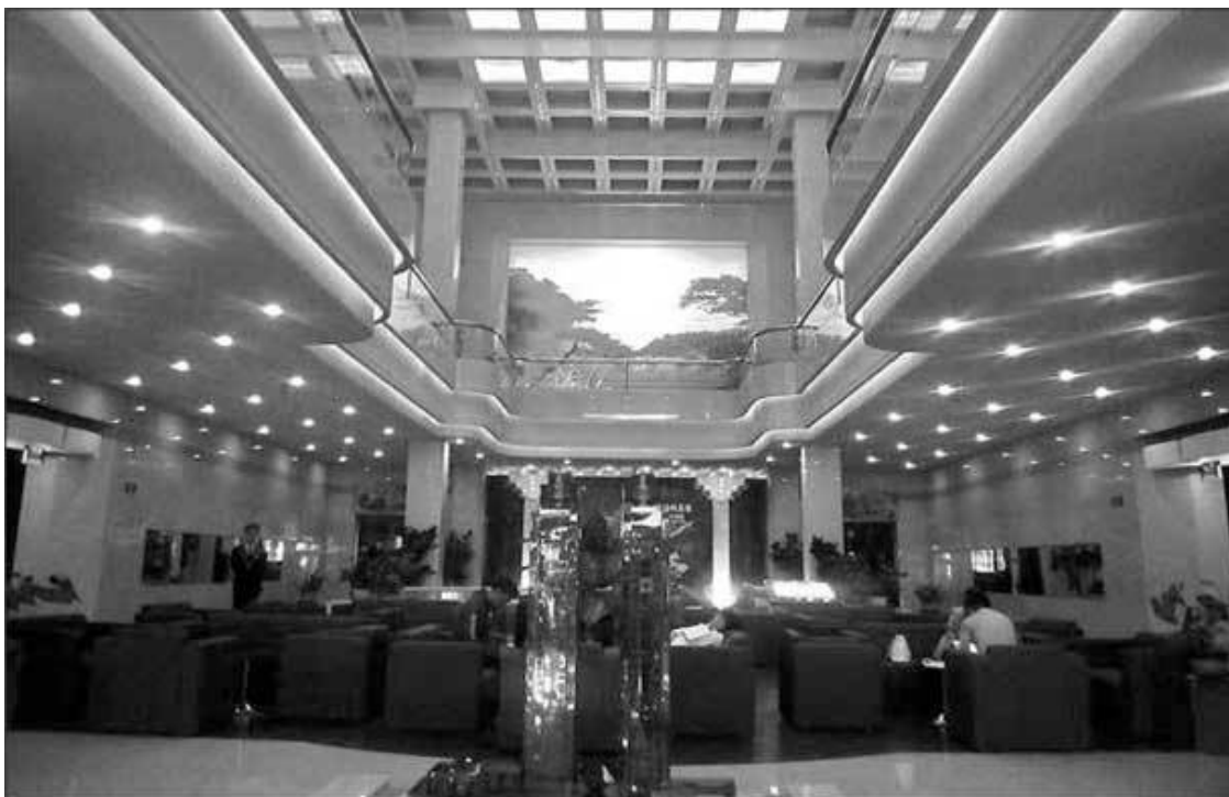
Интерьер гостиницы «Корё»

Номер нормальный, электричество и горячая вода были, даже электрочайник стоял. Можно ли пить воду из-под крана – не проверял. Каждый день в номер ставили поллитровую бутылку воды и полный набор туалетных принадлежностей, кроме бритвенного станка.