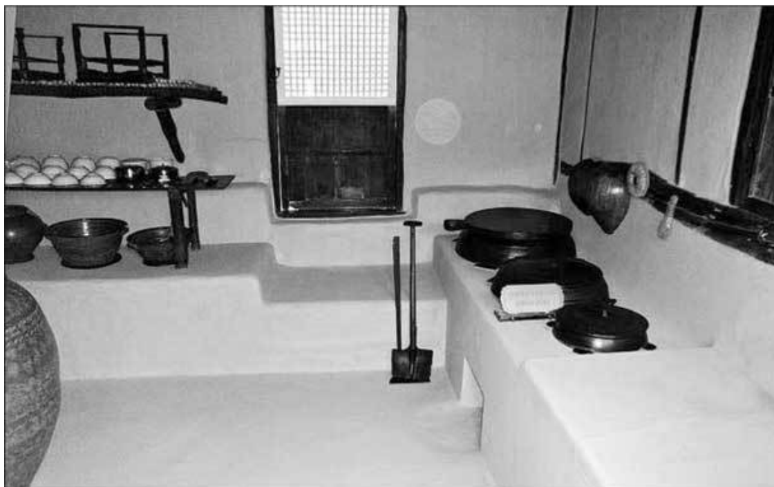
Кухня в доме родителей Ким Ир Сена в Мангёндэ

Японцы арестовали Ким Хен Чжика, и хотя улики на него оказались недостаточно для того, чтобы судить, в 1926 г. он скончался от последствий профилактических пыток: это была довольно частая судьба человека, познакомившегося с японской правоохранительной системой. После этого уже относительно взрослый Ким отправился мстить за отца и в том же 1926 г. создал так называемый «Союз свержения империализма». От этой даты в современной КНДР принято отсчитывать начало новейшей истории Кореи, и для официальной идеологии КНДР она имеет примерно такое же символическое значение, как 1917 г. для идеологии СССР.