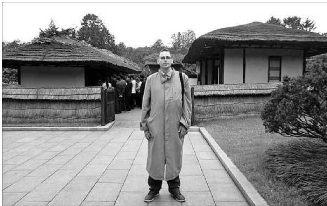
Автор в Мангёндэ

Семья Кимов поселилась там в 1862 г. по весьма любопытной причине. В местах, окружающих Мангёндэ, «очень хороший фэншуй». И хотя я не так силен в геомантии, как некоторые мои коллеги, места там действительно очень красивые и правильные с точки зрения размещения могил. Поэтому многие помещики или представители дворянских родов хоронили там своих предков. Однако за этими захоронениями надо ухаживать, и потому какая-нибудь бедная семья получала сторожку, арендовала землю и в дополнение к занятию сельским хозяйством должна была присматривать за могилами. Прадед Ким Ир Сена вроде бы был сельским старостой, дед и бабушка – рядовыми арендаторами, а отец и мать вождя относились к сельской интеллигенции.