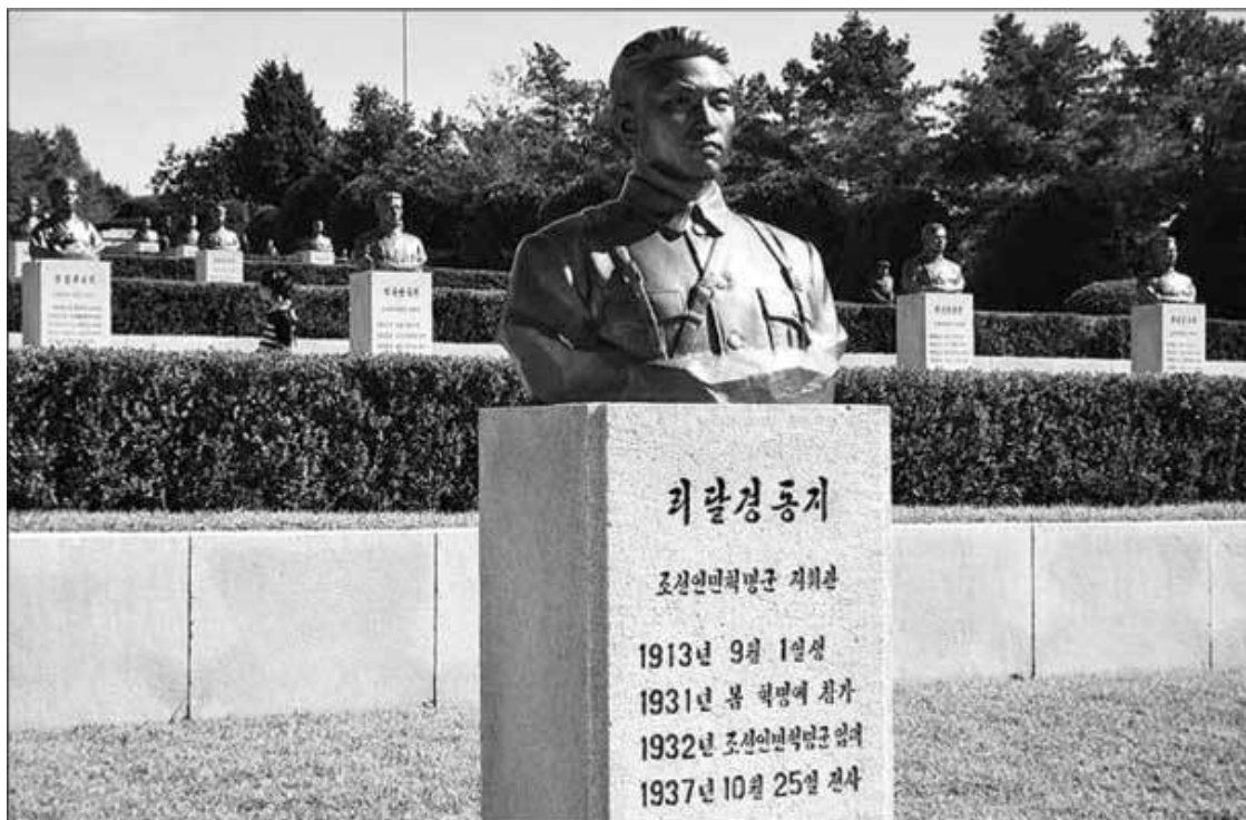
Тэсонсанское кладбище революционеров

На могильных памятниках стоят не только даты рождения и смерти, но и с точностью до месяца указано, когда данный товарищ начал заниматься революционной деятельностью. Все памятники однотипные: мраморный постамент, бронзовый бюст с очень высоким уровнем сходства с оригиналом. Везде указана причина смерти: погиб в бою ( чонса ), пожертвовал собой ( хыйсэн ), скончался ( сого ). Только последнее предполагает, что указанный соратник умер своей смертью.