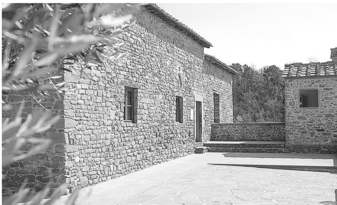
Дом, в котором родился Леонардо да Винчи, Тоскана