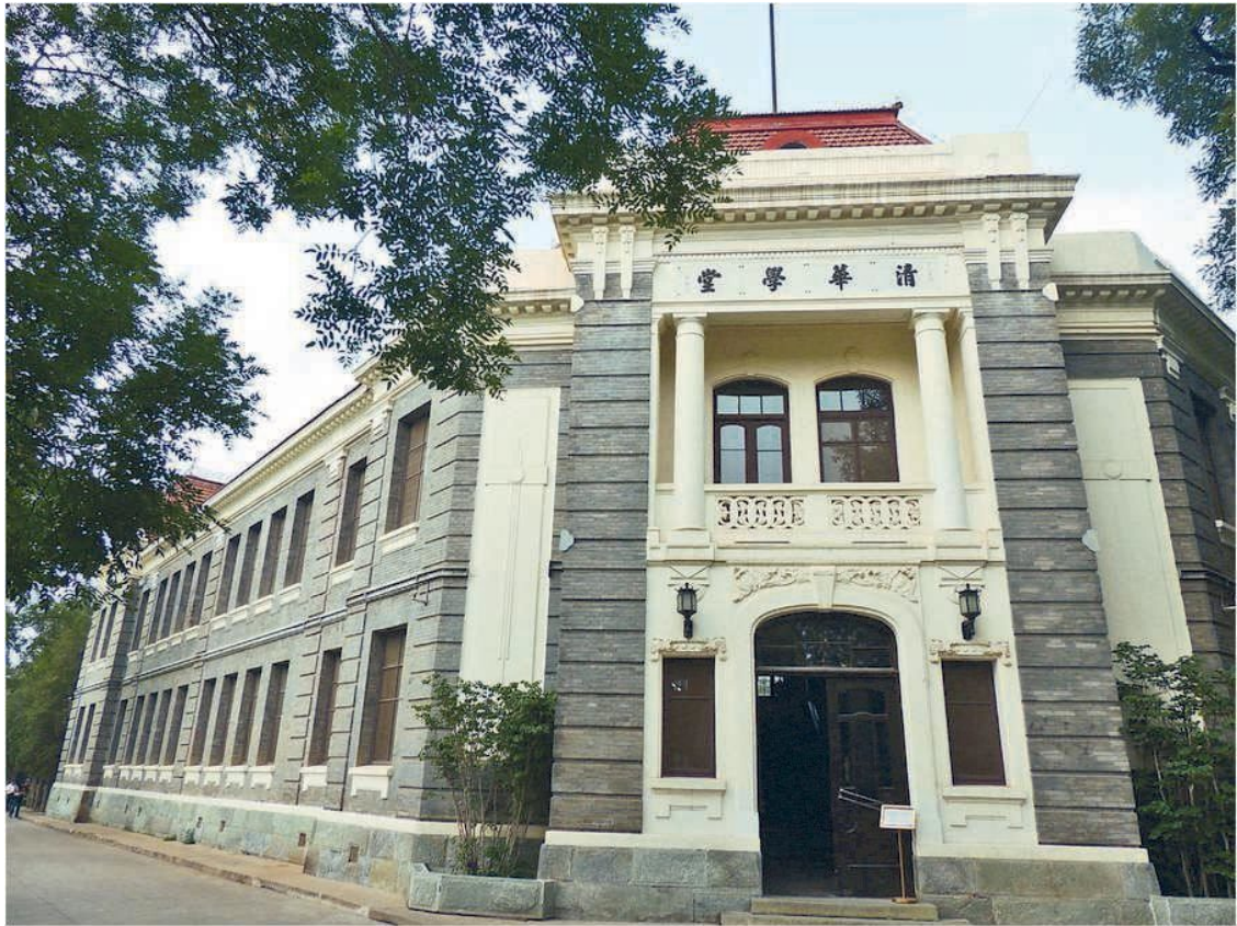
Университет Цинхуа, в котором в 1970-е гг. учился Си Цзиньпин. Пекин

Всего несколько дней потребовалось ветеранам компартии, возглавляемым Е Цзяньном, Ли Сяньнянем, Ван Дунсином и Хуа Гофэном, чтобы организовать арест «банды четырех» и не допустить повторения ужасов «культурной революции», полной экономической и политической катастрофы. В 1977 г. на XI съезде компартии были аннулированы все решения и приговоры времен «культурной революции». В сравнении с XX съездом КПСС Мао Цзэдуна, в отличие от Сталина, не объявили виновником всех бед партии и государства. Была избрана следующая формулировка: «на 70 % Мао был прав, на 30 % – ошибался». Как и в СССР после 1956 г., в Китае началась «оттепель». Из тюрем и ссылок стали возвращаться ветераны КПК, в том числе и отец Си Цзиньпина, Си Чжунсюнь.