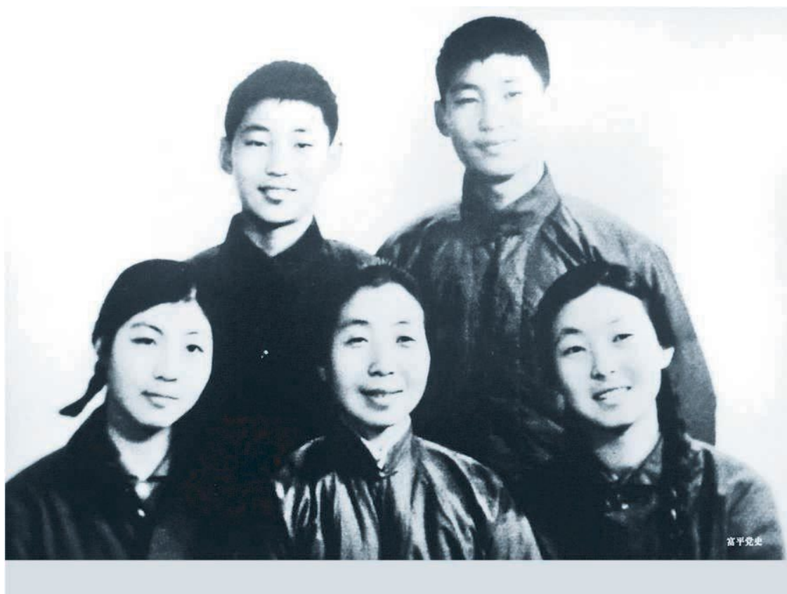
Си Цзиньпин с матерью, братом и сестрами. 1972 г.

Впитывая мудрость и дух прародины всех китайцев, Си Цзиньпин урывками читал учебники и немногие литературные произведения, оставшиеся незапрещенными, из деревянного ящика, в котором хранились его немногочисленные пожитки. Придумывал усовершенствования для деревенской жизни и производства. Его первой «инновацией» стала деревенская кузница, с помощью которой удалось решить проблему нехватки сельхозинвентаря, а местным жителям получить дополнительный доход. Затем появилась установка по производству биогаза, информацию о которой Си Цзиньпин почерпнул из газет. Так Лянцзяхэ стала первой в провинции деревней, обеспечившей себя электричеством и теплом. Получив в качестве премии мотоцикл, Си Цзиньпин обменял его на ручной трактор и мощный насос для всей деревни.