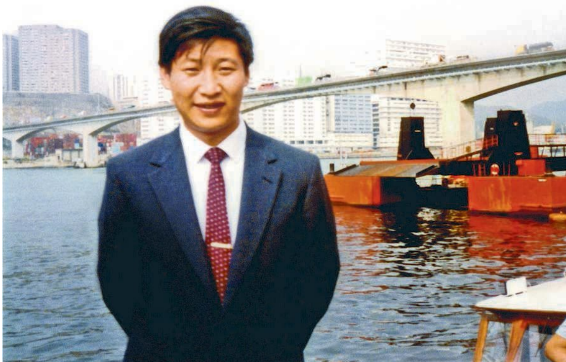
Си Цзиньпин во время одной из первых зарубежных поездок. Середина 1980-х годов

Однако и проблем у «страны Фуцзянь» даже через 22 года осуществления «политики реформ и открытости» оставалось немало. Неудивительно, что, став руководителем Фуцзяни, Си Цзиньпин сразу создал «руководящую группу по повышению эффективности органов власти». «Руководящая группа» – это ситуационный штаб, лишенный бюрократических ограничений и наделенный дополнительными полномочиями для решения конкретной проблемы. Результатом «мозговых штурмов» стало сокращение 40 % административных согласований в течение первого же года.