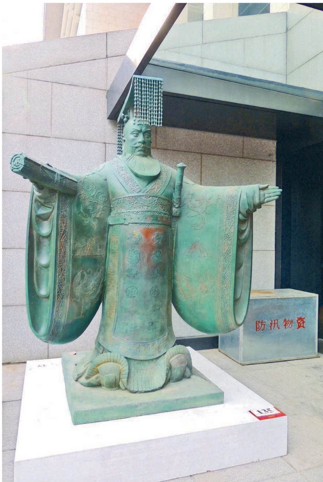
Император Цинь Шихуан-ди впервые объединил Поднебесную. Статуя в Национальном музее Китая. Пекин

У-ди боролся с коррупцией и расточительством, умиротворял готовивших заговоры удельных князей, обуздывал корыстолюбивых сановников. Не отказываясь совсем от идей