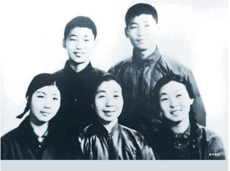
Си Цзиньпин с матерью, братом и сестрами. 1972 г.

Центральной Азии, Восточной и Западной Европы отправлялись караваны с китайскими товарами. В наши дни главный город провинции Шэньси Сиань (бывший Чаньань) является крупным промышленным, научным и транспортным центром Северо-Западного Китая.