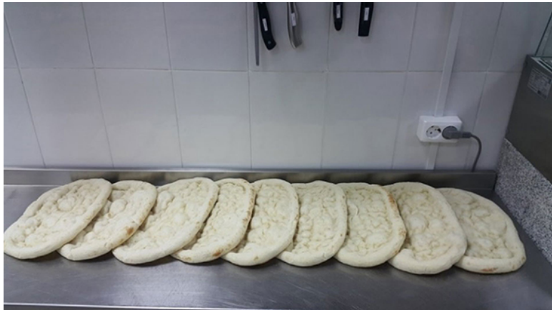
Телия (пан или сицилийское)