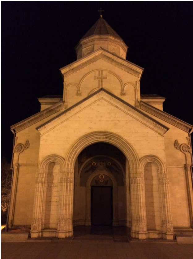
Храм Кешвати в Тбилиси. 1910 год

После октябрьской революции, 26 мая 1918 года Грузия объявила себя независимым государством, которое сокращенно именовалось по аналогии с будущей социали-