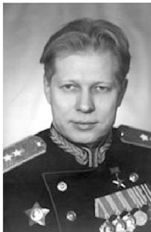
Дмитрий Устинов, фотография 1950-х годов

Личная жизнь: женат на Виктории Петровне (урожд. Денисовой) с 1927 г., двое детей. Любитель охоты на крупного зверя, футбола и вождения (в т.ч. раритетных иностранных автомобилей).