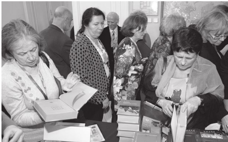
Знакомство с изданиями Международного Центра Рерихов