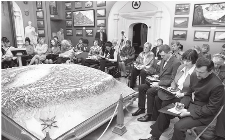
Участники конференции в одном из залов Музея имени Н.К.Рериха