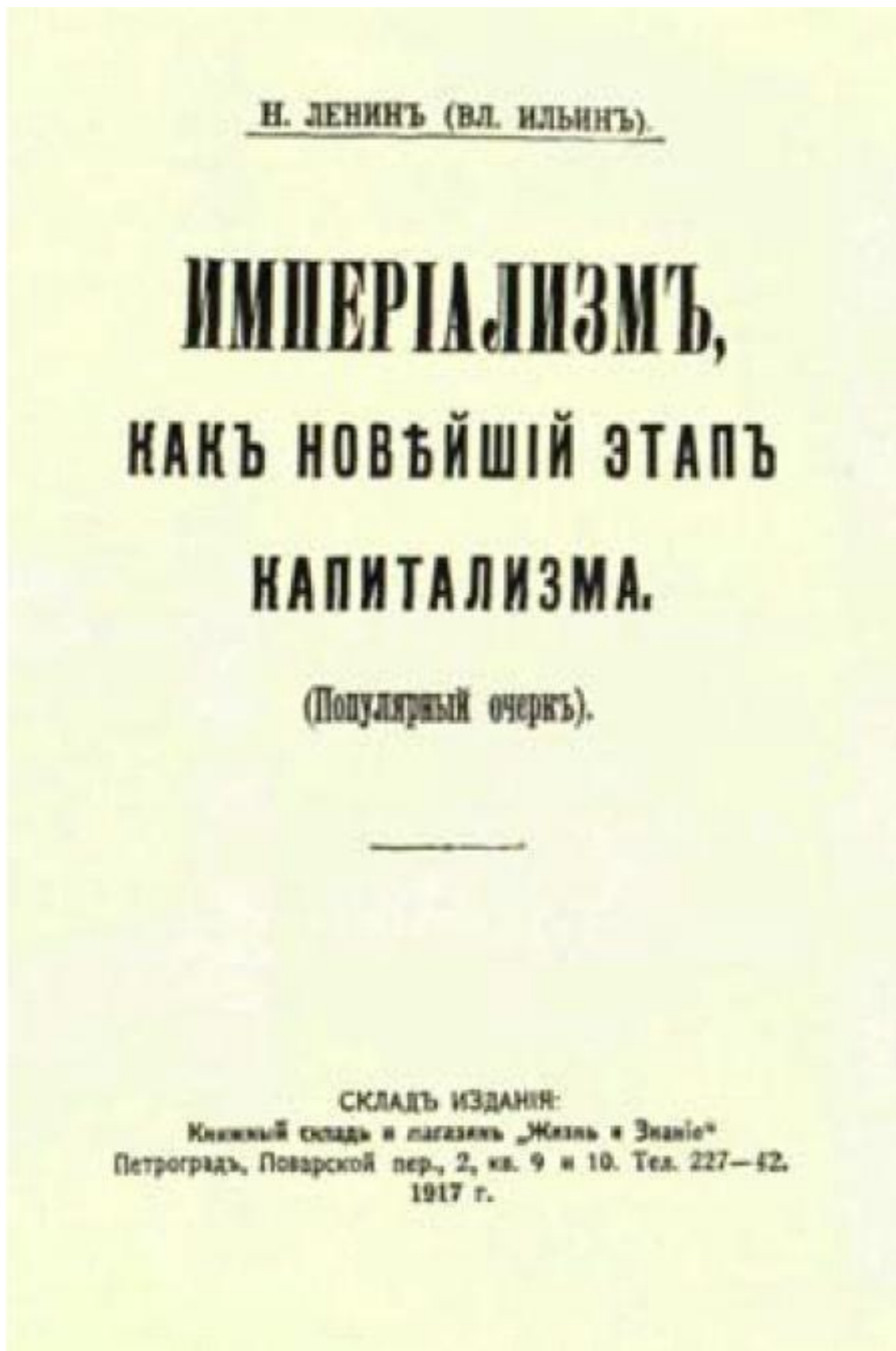
Обложка книги В. И. Ленина «Империализм, как высшая стадия капитализма». – 1917 г. (Уменьшено)