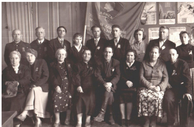
Работники Георгиевского райкома ВЛКСМ с комсомольцами 20-30-х годов, 1958 год