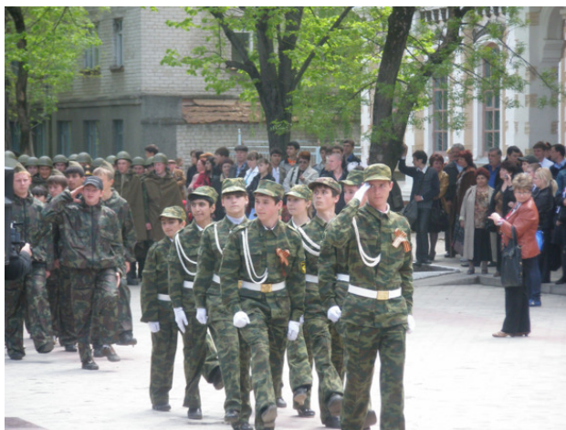
Юнармейцы на параде в честь Победы в Великой Отечественной войне