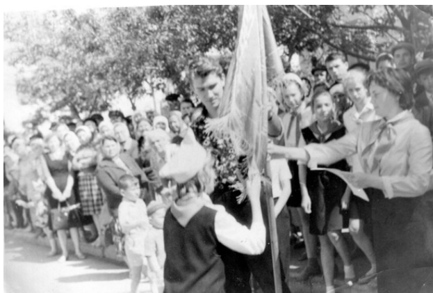
Клятва у пионерского знамени