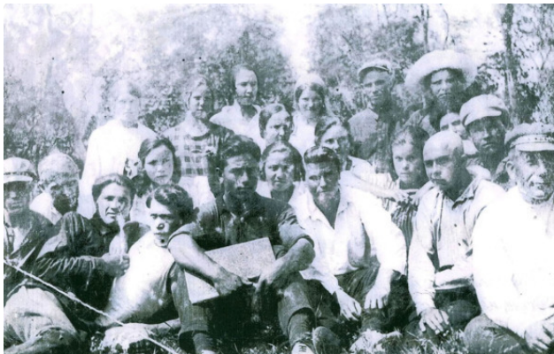
Комсомольцы колхоза «Коммунистический маяк». 1925 год