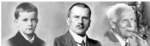
Портреты К. Г. Юнга

Аналитическая психология – направление неопрейдизма, основателем которого является швейцарский психолог К. Г. Юнг. Данная психология основана на понятии коллективного бессознательного, в котором нашли отражение данные антропологии, этнографии, истории культуры и религии, проанализированные Юнгом в аспекте биологической эволюции и культурно—исторического развития, и которое проявляется в психике индивида. В качестве единицы анализа психики Юнг предложил понятие архетипа как врожденного образца поведения, соответствующего различным пластам психики человека: животного, общечеловеческого, родового, семейного и индивидуального.