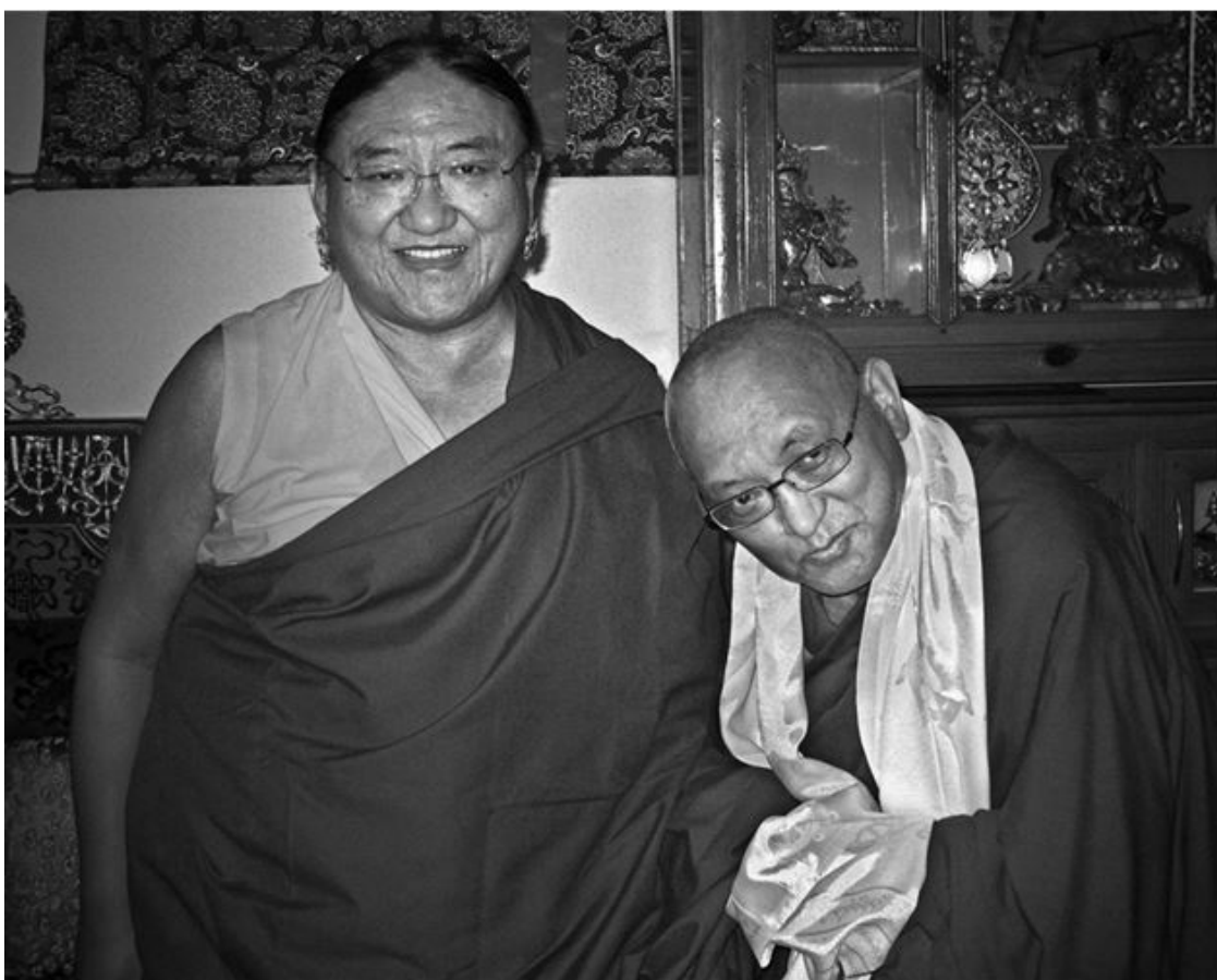
(На фото – Сакья Тризин Ринпоче с ламой Сопой Ринпоче. Лама Сопы Ринпоче и Е.С. Сакья Тризин в Дерадуне, Индия, 2008 г.)

В силу благих заслуг, созданных помощью в распространении учений Будды ради блага всех живых существ, да будет у наших благодетелей и их семей и друзей долгая и здоровая жизнь и счастье, и пусть мгновенно исполнятся все их устремления в Дхарме.