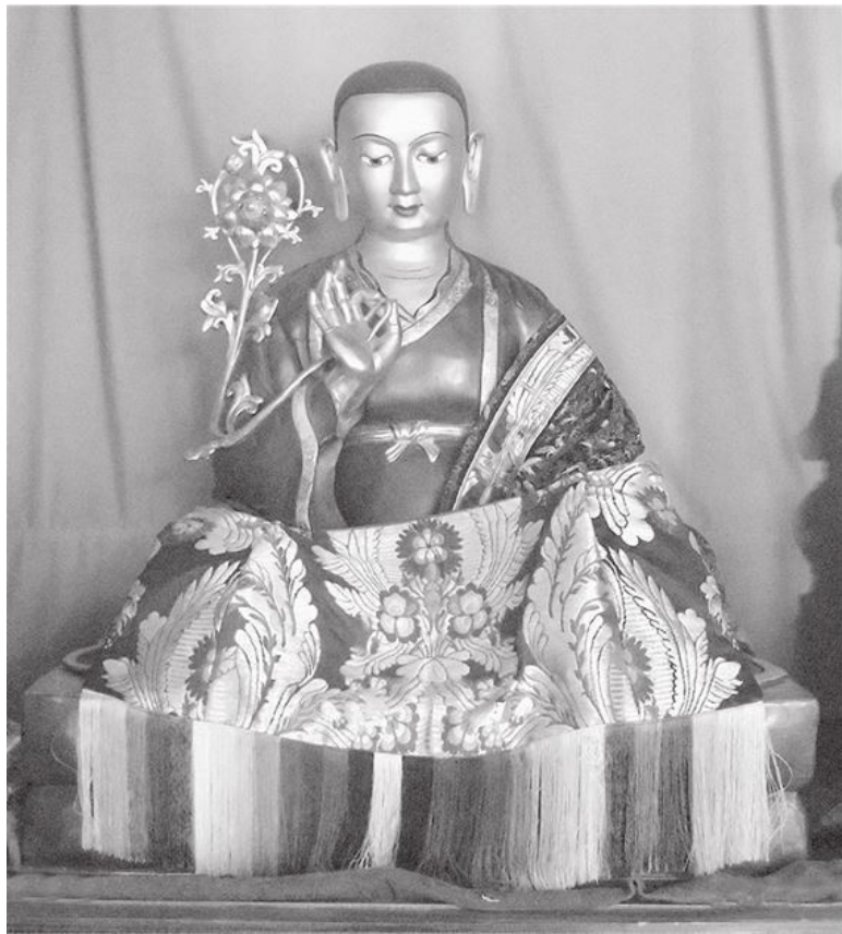
Лама Дромтонпа (Дромтон Гьялве Джунгне, 1005–1064).