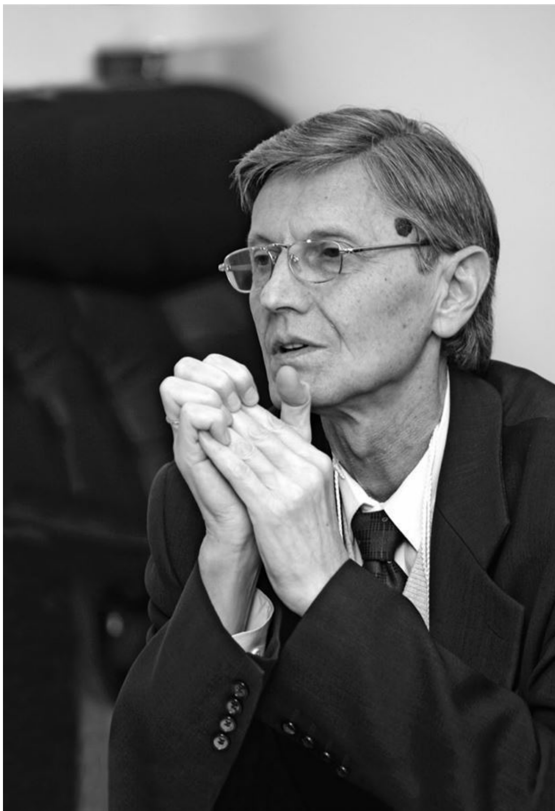
Академик РАН, директор Международного института теоретической и прикладной физики РАН А.Е.Акимов