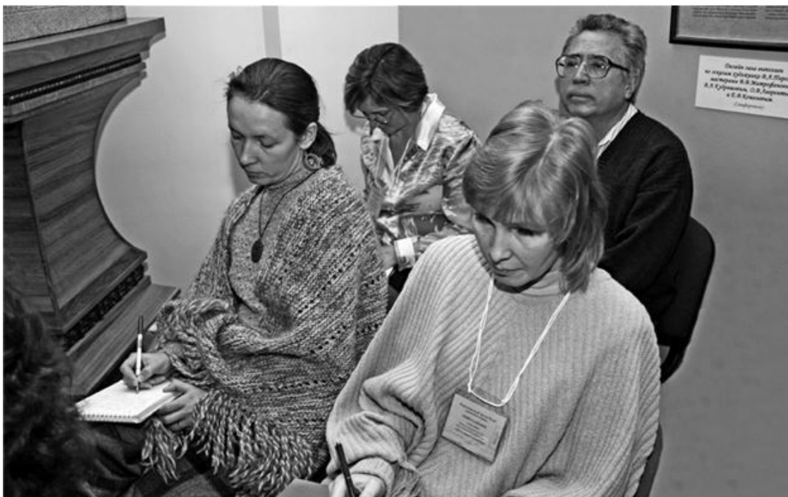
В зале во время заседания