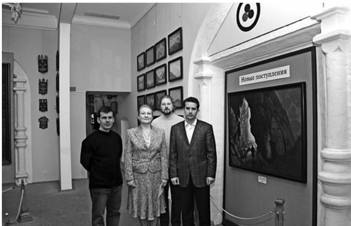
Сотрудники отдела передвижных выставок Музея имени Н.К.Рериха