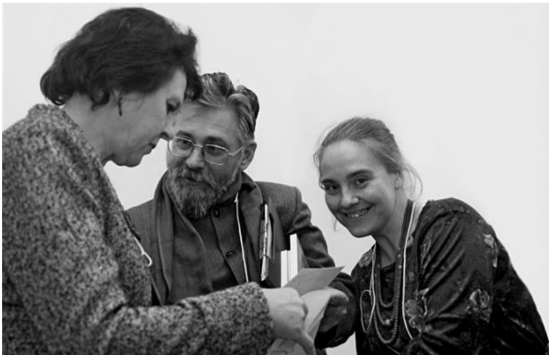
Обмен мнениями в перерыве между заседаниями