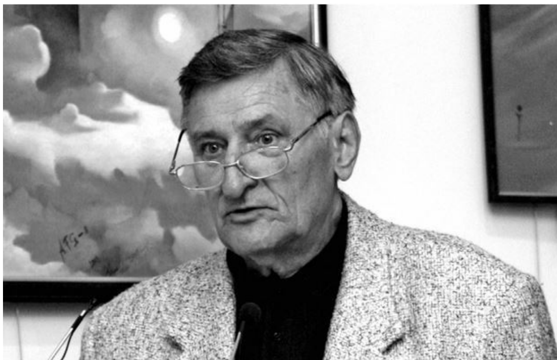
Вице-президент Российской академии космонавтики им. К.Э.Циолковского Б.Н.Кантемиров