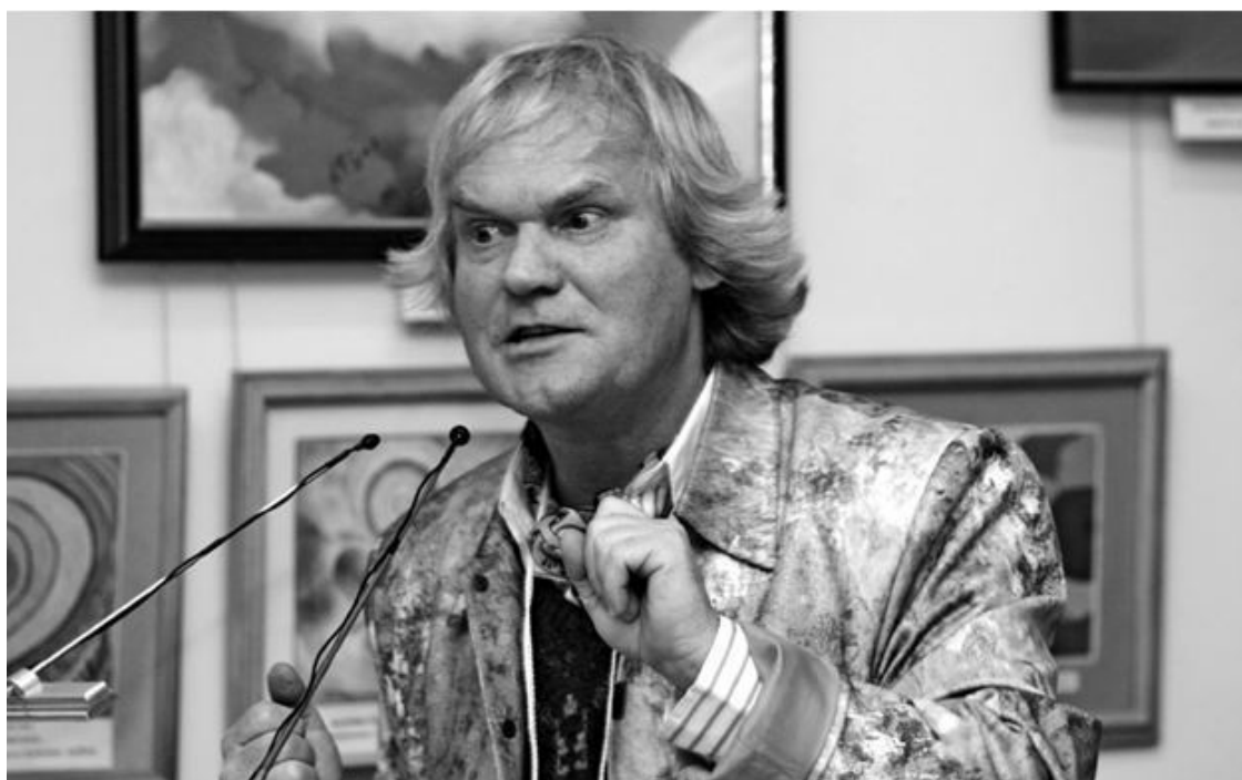
Народный артист России, кавалер ордена «Надежда нации» Ю.Д.Куклачев