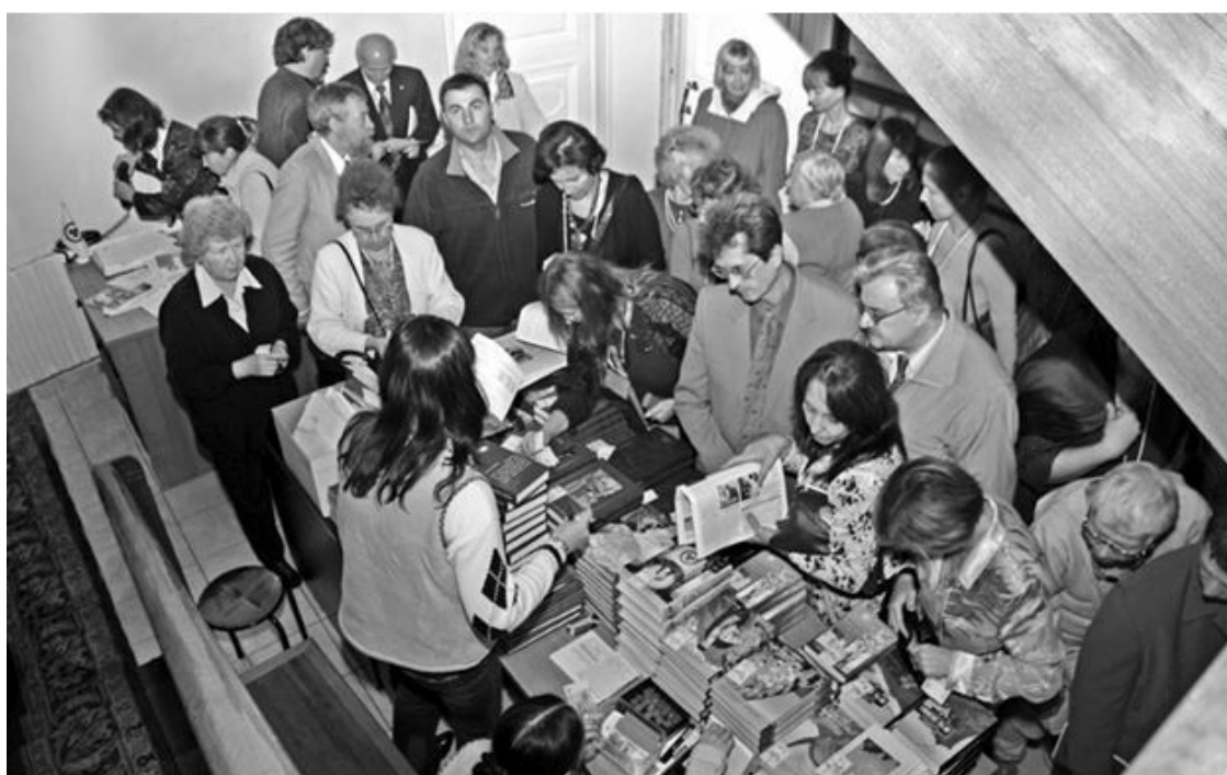
Издания МЦР, подготовленные к началу работы конференции, пользовались большим спросом