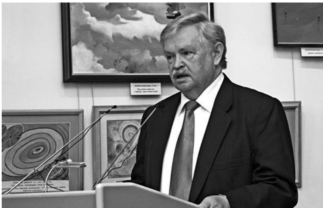
Академик Российской академии образования, президент Международной ассоциации детских фондов, председатель Российского детского фонда А.А.Лиханов