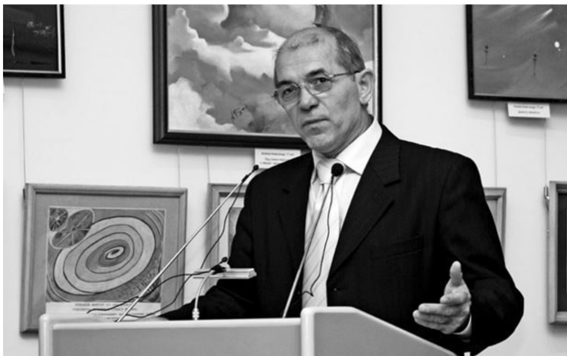
Президент Мирового Артийского комитета, представитель Общественной палаты РФ В.М.Тарбоков