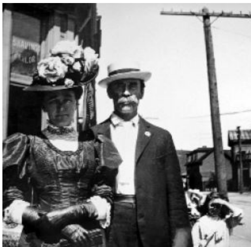
Жозефина и Роберт Пири