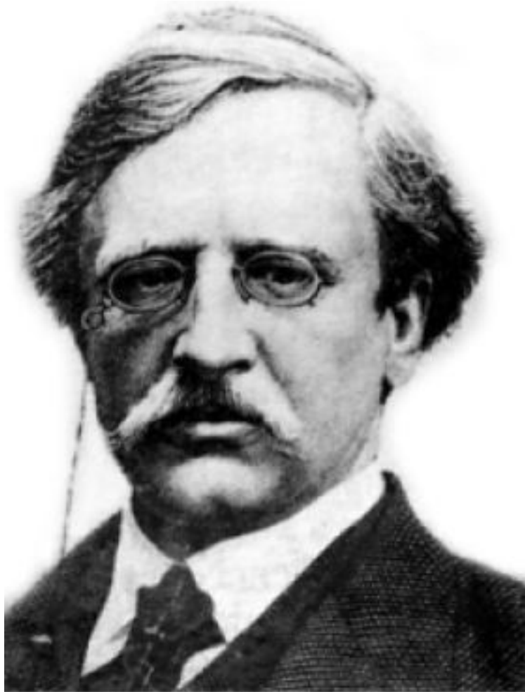
Нильс Адольф Эрик Норденшельд