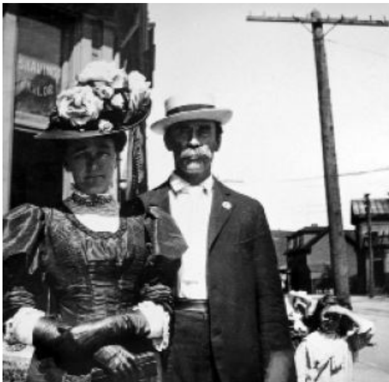
Жозефина и Роберт Пири