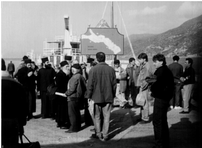
Преподобный Паусий на пристани в Дафни