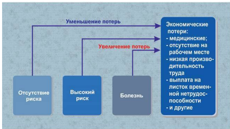
Рисунок 1. Матрица увеличения расходов при отсутствии корпоративных программ здоровья и благополучия

Иногда мы думаем: «Ладно, не будем ничего делать, как-то само разрешится. Зачем напрягаться? ...» Но, согласно научным данным, такой подход уже не работает. Есть только два варианта развития ситуации: уменьшать риски, уменьшая стоимость, или не делать ничего. Последнее предполагает бездействие, т.е. риск, который только накапливается и приводит к увеличению стоимости расходов на персонал каждый год.