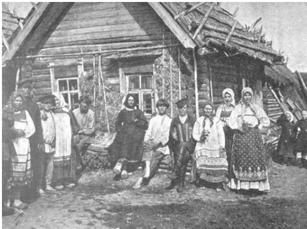
Крестьянская семья Рязанской губернии

Деревенские мужики, когда барин разрешал съездить на ярмарку, гадали: «Ежели ехать в Ташенку, то товару в Токарёве, как пить, будет больше! Ежели выбрать Токарёво, то гулянье в Ташенке пропустим! Куды податси?» Бабы не выбирали: «Куды? Куды? В Лом помолитси, а посла в Ташенке повеселитси. В Токарёве ситцу оне больше, да чаго в нёму проку? Все одно разбойники отберуть». Своя правда у баб, конечно была. В Ломе находилась Богородицерожденственная церковь, куда были приписаны шепелеские и бреевские прихожане. В Ташенку дорога открытая, перегнул через бугор, проехал Бреево