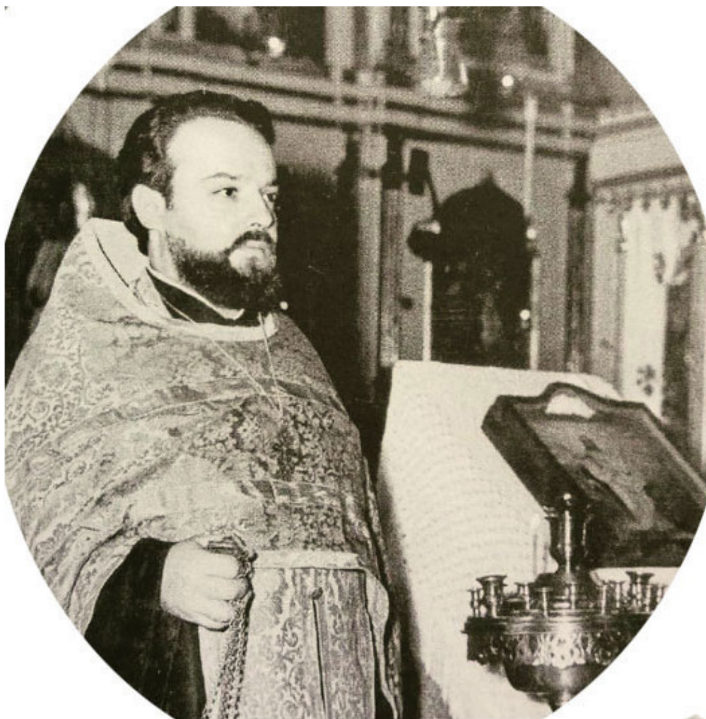
о. Александр Мень