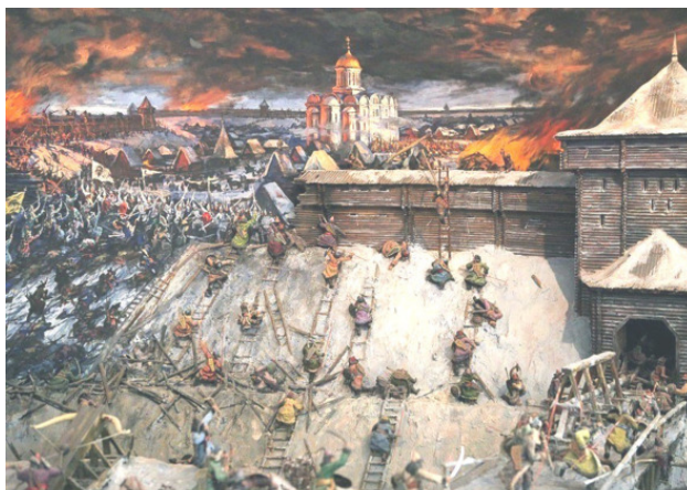
Диорама «Героическая оборона Старой Рязани от монголо-татарских войск в 1237 году»

Там, где стояли городские укрепления, сохранились валы, а близ реки, под холмом, где находилось кладбище, сохранилась полуразрушенная, разорённая церковь. Само место напоминало об истории, да и местные мальчишки рассказывали обо всём, что здесь происходило в XIII веке так, как будто они сами, или по крайней мере их родители всё видели. Я любил бывать на кладбище, рисовать памятники и любил заходить в церковь. Да, там всё было разорено, но было так таинственно. Оставалось какое-то ощущение, что там есть то, чего нет в другом месте. И представлялось, что когда-то, не так уж и давно, вот здесь разжигали кадило, и плыл по церкви кадильный дым. И люди стояли и молились, и священники служили в своих облачениях... И вот мы с местными обсуждали: может Бог всё же есть?