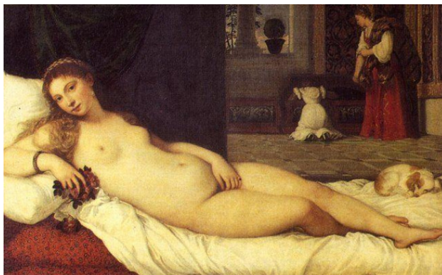
Олимпия – Тициан

Он часто писал эту раскованную женщину, а в параллель ей шли замечательные романы Золя, Бальзака, Жорж Санд и то, что они описывали, были не просто нравы, не просто история в литературе, а высокие, очень чувствительные инструменты времени. Вернуться назад, чтобы идти вперед! Мане абсолютно плакатно говорил: «Иду туда, чтобы выйти там. Я иду назад, чтобы выбросить искусство вперед!» Мане движется за Тицианом. Почему он идет за ним? Потому что это точка, от которой отправляются поезда. Он возвращается к этой точке, чтобы идти вперед. Как говорил замечательный Хлебников: «Для того, чтобы выйти вперед к верховью, мы должны подняться в устье». То есть к истоку, откуда течет река.