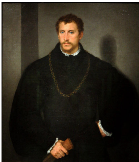
Портрет неизвестного с серыми глазами

Если суммировать то, что мы знаем о венецианцах и о Тициане, то можно сказать, что в мире, который улавливает Венецию с ее особой жизнью, с ее сложной социальной продуктивностью и исторической бурливостью, то можно и увидеть, и ощутить внутреннюю заряженность системы, которая готова вот-вот разрядится. Посмотрите на этот тициановский портрет, что висит в галерее дворца Питти.