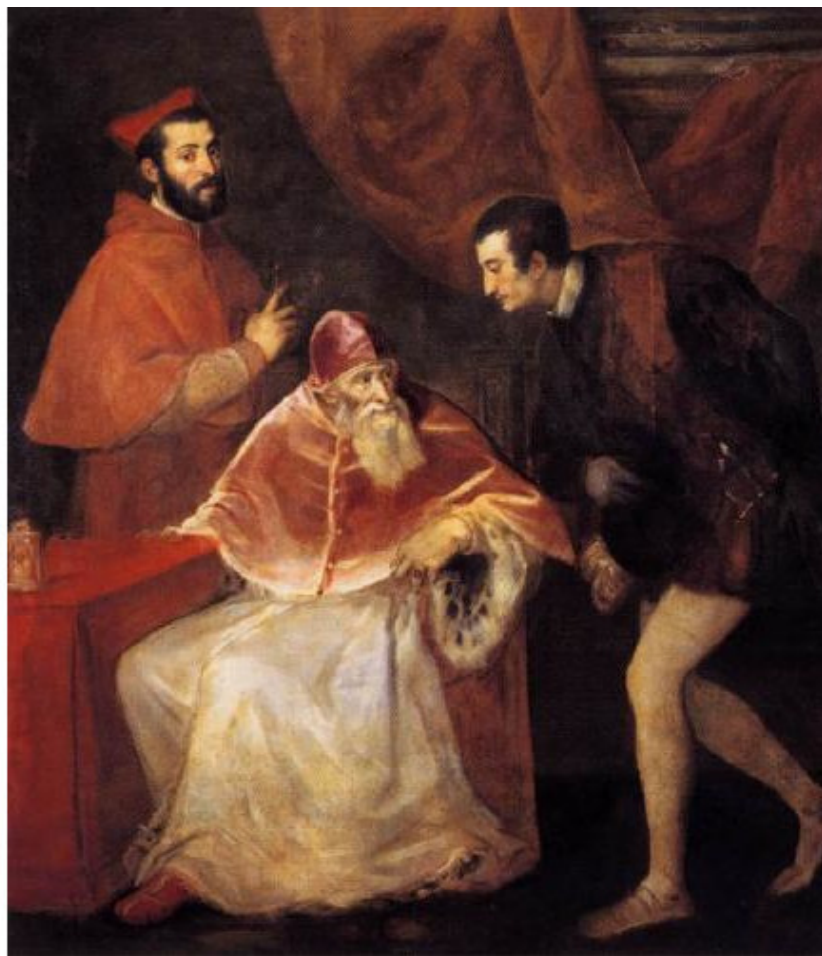
Павел III и племянники