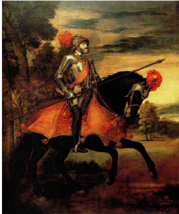
«Конный портрет» Карла V