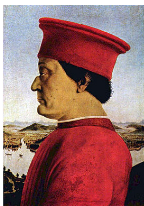
Федерико да Монтефельтро

Здесь всего лишь видимость считывания. Здесь есть что-то многоосмысленное, потому что не возможно однозначно дать полную характеристику человека, из-за того, что есть энергетика и то, что каждый из нас обнажает или прячет в себе. Это все сложный текст. Когда Тициан пишет мужской портрет, он выделяет лицо, жест, руки. Остальное, как бы спрятано. На этой драматургии строится и все остальное.