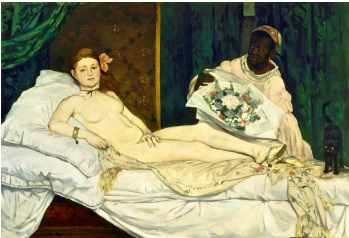
Олимпия – Мане

Куртизанками того времени были женщины не из грязных предместий. Нет! Они были гетерами: умными, образованными, умеющими себя преподнести, дающими импульс обществу. Высший импульс! У них были свои клубы или салоны, где они принимали своих гостей.