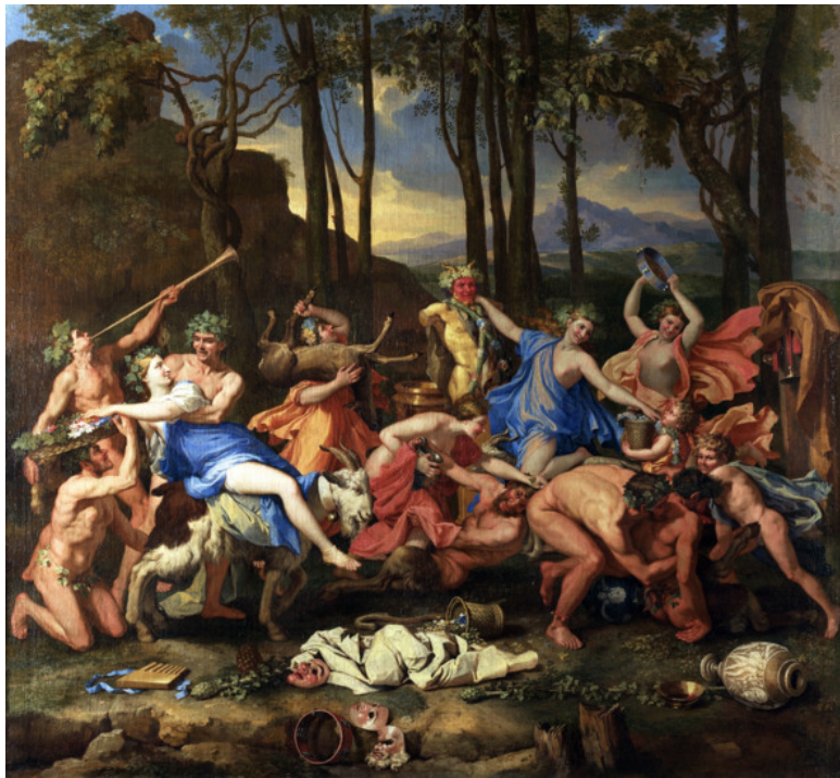
Вакханалия. Никола Пуссен

Пегас был так популярен, что стал символом города Коринфа. Примерно с 550 г. до н.э. там начинают чеканить серебряные монеты с изображением Пегаса. Назывались они статер и были весьма весомы: примерно 3 драхмы (8,7 гр. серебра).