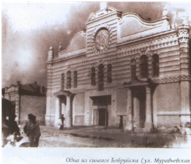
Одна из синагог Бобруйска (ул. Муравьевская)

Большая синагога на ул. Муравьевской, теперь ул. Социалистическая