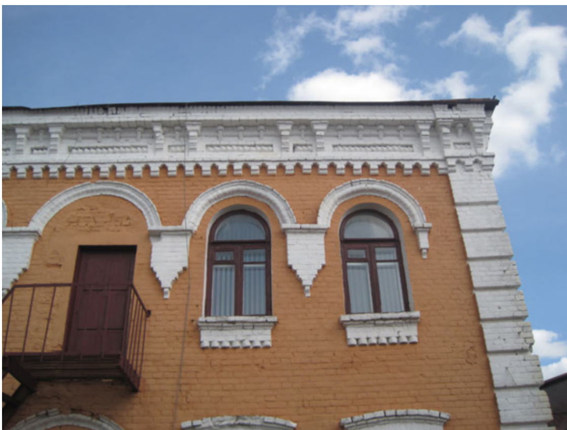
Фото из источника в списке литературы [4]

В конце 19-го столетия Бобруйск считался городом читающим и «просвещённым». В нем официально были типографии (шесть), типолитографии (две). Однако типографии были и нелегальные (тайные). Так в 1904-м году в принадлежащем Гельфанду доме (расположенном на Слуцкой улице) в квартире, где проживал Арон Лиокумович, была именно такая нелегальная типография, в которой печатали прокламации и листовки.