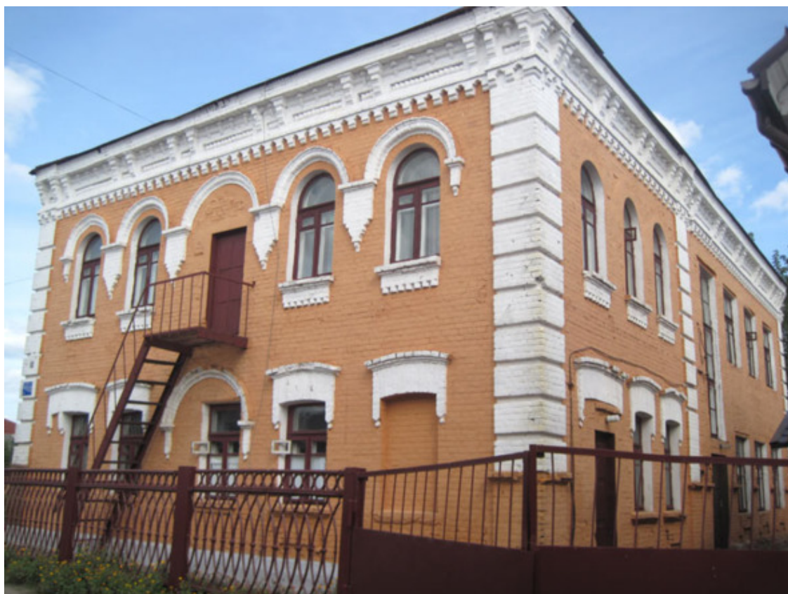
Фото из источника в списке литературы [4]

Здание синагоги было возведено в конце девятнадцатого столетия – в начале столетия двадцатого. Когда синагогу закрыли, в ее здании имело место размещение тюрьмы МГБ, а также «Бабрани», являвшимся центром краеведения, экскурсий и туризма детей и молодежи.