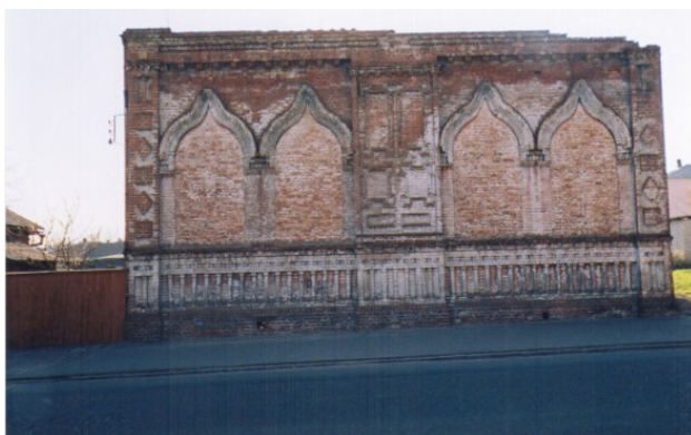
Фото из источника в списке литературы [2]

В 1917-м году в городе Бобруйске насчитывалось ни много, ни мало – сорок две действовавших синагоги. Перед войной синагог было несколько десятков. Почти все они оказались уничтоженными.