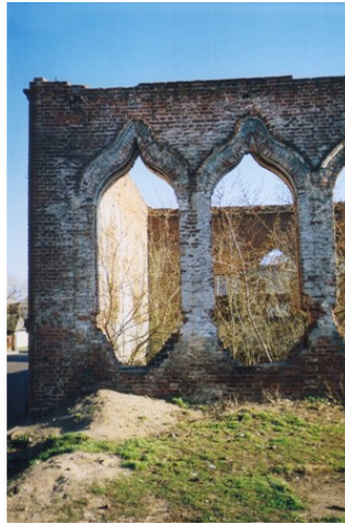
Фото из источника в списке литературы [2]

ванную еврейскому брестскому кагалу, считают первым датированным источником, имеющим отношение к началу распространения иудаизма.