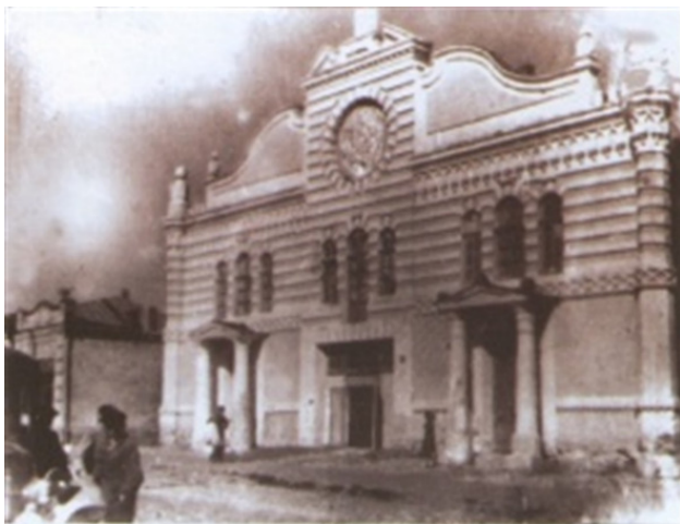
Одна из синагог Бобруйска (ул. Муравьевская)