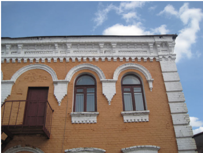
Фото из источника в списке литературы [4]