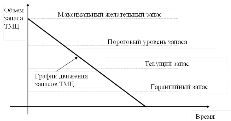
Рисунок 1.1 – Классификация запасов по времени

Максимальный желательный запас определяет верхний уровень запаса, экономически целесообразный в данной системе управления запасами. Этот уровень используется как ориентир при расчете полезной площади склада, необходимой для размещения товара, а в отдельных системах управления запасами при определении размера заказа.