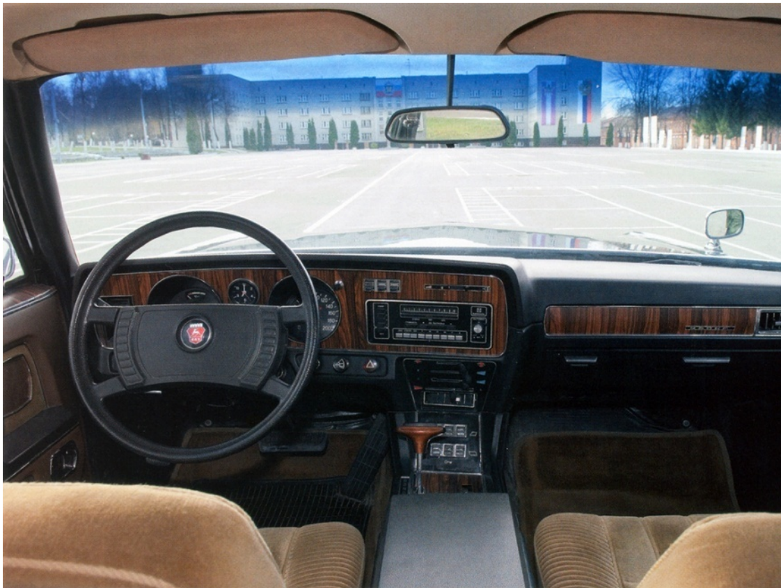
Интерьер автомобиля ГАЗ-14 «Чайка»

Большого приза. Автоматическая коробка передач, рулевое управление с гидроусилителем значительно облегчили управление автомобилем. Автомобиль ГАЗ-13 выпускался без значительных изменений продолжительное время.