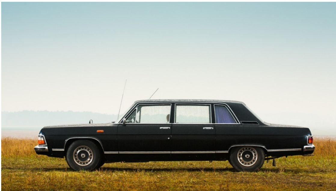
Автомобиль ГАЗ-14 «Чайка»

Второе поколение – автомобиль ГАЗ-13 «Чайка» (1959 г.) – представляло дальнейший шаг вперед в отношении развития