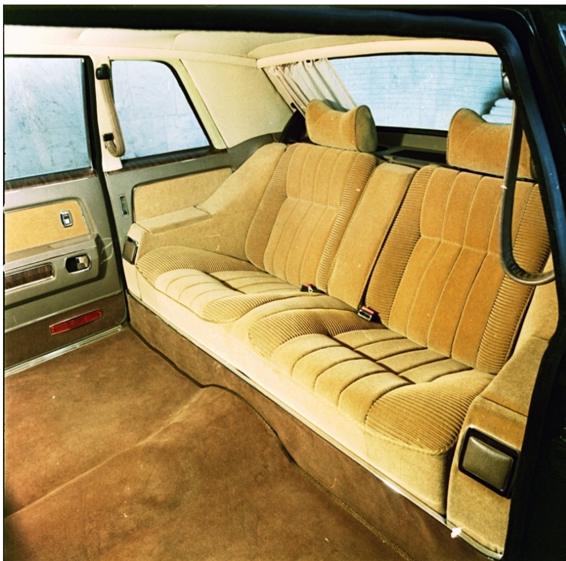
Рисунок 3. Интерьер автомобиля ГАЗ-14 «Чайка»

При разработке автомобиля большого класса третьего поколения ставились следующие задачи: обновить внешнюю форму и интерьер кузова, улучшить динамические показатели, выполнить современные требования безопасности конструкции, облегчить управление автомобилем, применить прогрессивные решения в конструкции агрегатов.