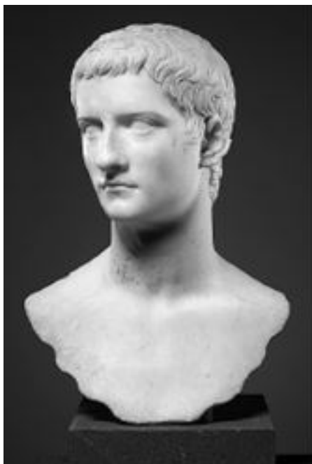
Мраморный бюст императора Гая, известного как «Калигула». 37–41 года. Метрополитен-музей, Нью-Йорк

Через несколько дней (очень быстро для той эпохи!) 25-летний Калигула был уже в Риме. Он опередил второго наследника Гемелла и был встречен искренним ликованием: ведь для римлян это был сын Германика и Агриппины, тот самый мальчик, что в детских сапожках нес урну с прахом отца! Сенат, видя ликование народа, поспешил присвоить Калигуле, не имевшему вообще-то никаких заслуг, титул Август – Божественный.