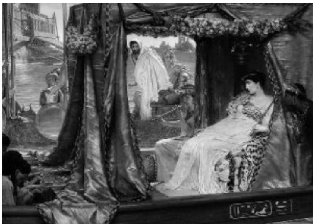
Лоуренс Альма-Тадема. Встреча Антония и Клеопатры. 1888. Частное собрание

Исторический момент оказался вполне подходящим для применения военных талантов. Во второй половине II века до н. э., во времена братьев Гракхов, искренне стремившихся спасти республику, начался кризис полисной системы управления. Республика обладала множеством замечательных черт. Все должности были выборными. Среди них существовала и такая, как народный трибун – человек, в доме которого никогда не закрывается дверь: к нему всегда можно прийти за заступничеством. Народный трибун имел право вето и мог помешать принятию любого постановления великого Сената.