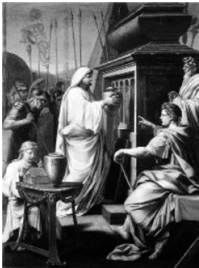
Эсташ Лёсюёр. «Калигула помещает прах матери и брата в гробницу предков». 1647. Виндзорский замок, Виндзор

Гай Калигула жил с матерью, пока она оставалась в Риме, а потом его взяла под свою защиту вдова Октавиана Августа Ливия. Юноша получил правильное римское образование и воспитание. Он знал древнегреческий язык, читал современных авторов, занимался риторикой, однако больше всего ему нравились танцы.