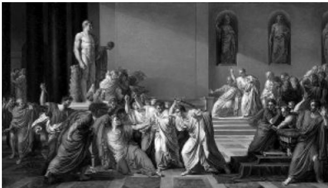
Винченцо Камуччини. Смерть Цезаря. ок. 1806. Музей Каподимонте, Неаполь

В период консульства Цезаря, в 59 г. до н. э., и был замечен Марк Антоний, который к тому времени уже продвинулся по военной службе и стал начальником конницы у проконсула Сирии Габиния. Это была важная и уважаемая должность. Триумвират направил Габиния и Марка Антония в Египет, чтобы помочь царю Птолемею XII Авлету (отцу прекрасной Клеопатры VII) подавить бунт, во время которого трон захватила Клеопатра VI.