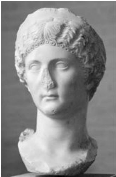
Юлия Друзилла, сестра Калигулы. Глиптотека, Мюнхен

гула вдруг велел всем снять шлемы и собирать в них ракушки. Смысл этого приказа так и остался загадкой. Видимо, это было одним из первых проявлений безумия.