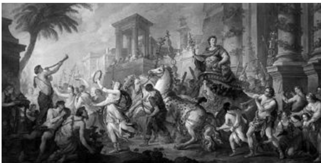
Шарль-Жозеф Натуар. Прибытие Марка Антония в Эфес. 1741. Музей изобразительных искусств Нима, Ним

В 45 г. до н. э. Цезарь вернулся в Рим, по пути разбив Боспорского царя Фарнака. Именно об этом он писал Клеопатре: «Пришел, увидел, победил». Ему было за сорок, и он хотел, чтобы молодая возлюбленная оценила его доблесть. Он прибыл в Рим триумфатором (это был его четвертый по счету триумф). Марк Антоний был правой рукой Цезаря, но о заговоре против него, видимо, не знал.