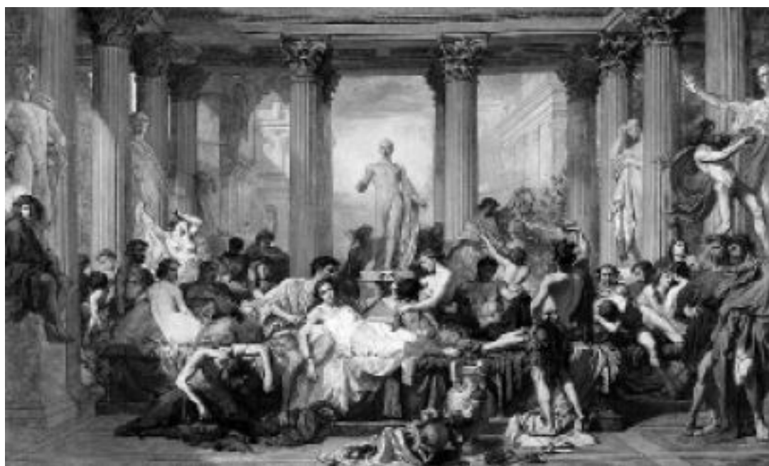
Тома Кутюр. Римляне времен упадка. 1847. Музей Орсе, Париж

Это было не единственное, что он позаимствовал у Востока. Его знаменитые кровосмесительные связи с сестрами (о чем так много сегодня написано) тоже вполне соответствовали традициям, например, египетской монархии. Фараоны нередко женились на собственных сестрах, и это считалось нормальным. Калигула же открыто обожал свою сестру Друзиллу, есть предположение, что он даже вступил с ней в брак. А когда она внезапно умерла совсем молодой, приказал ее немедленно обожествить, что было услужливо выполнено Сенатом.