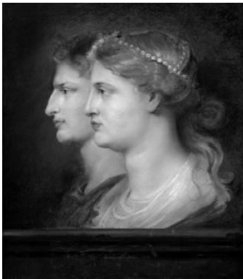
Питер Пауль Рубенс. Германик и Агриппина Старшая. 1614. Национальная галерея искусства, Вашингтон

Объявив, что у него есть долг перед семьей, Калигула отправился на небольшом корабле (это была трирема – судно с тремя рядами гребцов) в плавание по Тирренскому морю и посетил острова, где замучили его мать и братьев. До Рима доходили слухи о том, что он собственными