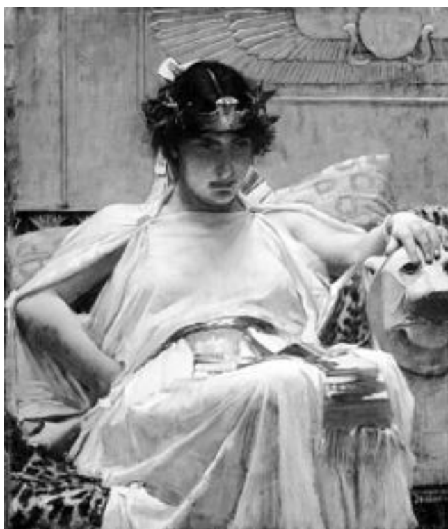
Джон Уильям Уотерхаус. Клеопатра. 1888. Частная коллекция

Сенат не разделял столь восторженного отношения к Цезарю и намеревался принять постановление, ограничивающее его полномочия. Однако народные трибуны Марк Антоний и Луций Кассий Лонгин наложили на него вето. Тогда был отдан приказ арестовать народных трибунов – большая политическая ошибка! Арест народного трибуна – это покушение на святыне принципы римского мироустройства.