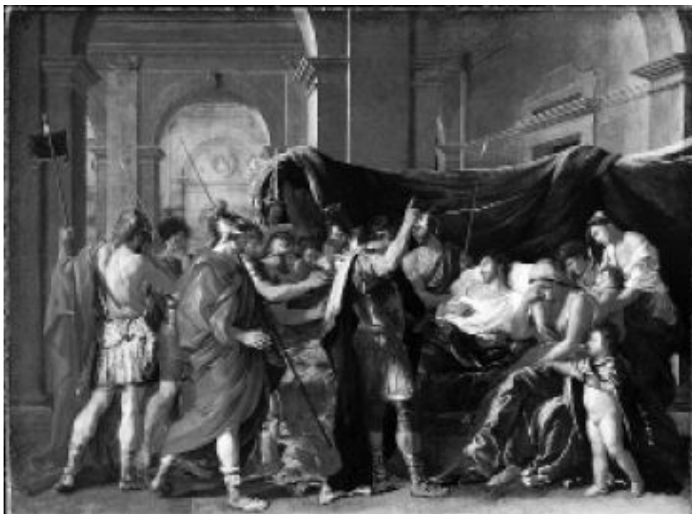
Никола Пуссен. Смерть Германика. 1626–1628. Художественный институт, Минеаполис

Сценарий оказался на удивление похож на убийство Гая Юлия Цезаря в 44 г. до н. э. Заговорщики решили, что после театрального представления каждый должен нанести удар проклятому Калигуле. После театра император направился в термы. Он несколько раз менял маршрут, и преследователи метались по улицам, не в силах его найти. В конце концов они настигли его и с кличем «Делай это!» (так кричали при жертвоприношениях) нанесли Калигуле множество ударов мечами. Это и было своего рода жертвоприношение уходящей в прошлое Римской республики. И хотя впереди были и достойные императоры, такие как Марк Аврелий, все равно великий Рим шел к неминуемой гибели.