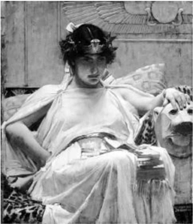
Джон Уильям Уотерхаус. Клеопатра. 1888. Частная коллекция

У Марка Антония появились основания опасаться за свою жизнь. Ведь относительно незадолго до этого, в 60-х гг. до н. э., был разоблачен заговор аристократа Катилины, а его участники арестованы и казнены в Мамертинской тюрьме.