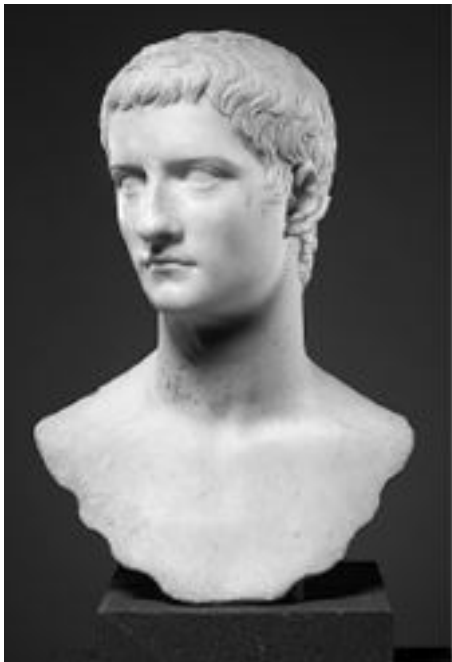
Мраморный бюст императора Гая, известного как «Калигула». 37–41 года. Метрополитен-музей, Нью-Йорк

Через несколько дней (очень быстро для той эпохи!) 25-летний Калигула был уже в Риме. Он опередил второго наследника Гемелла и был встречен искренним ликованием: ведь для римлян это был сын Германика и Агриппины, тот самый мальчик, что в детских сапожках нес урну с прахом