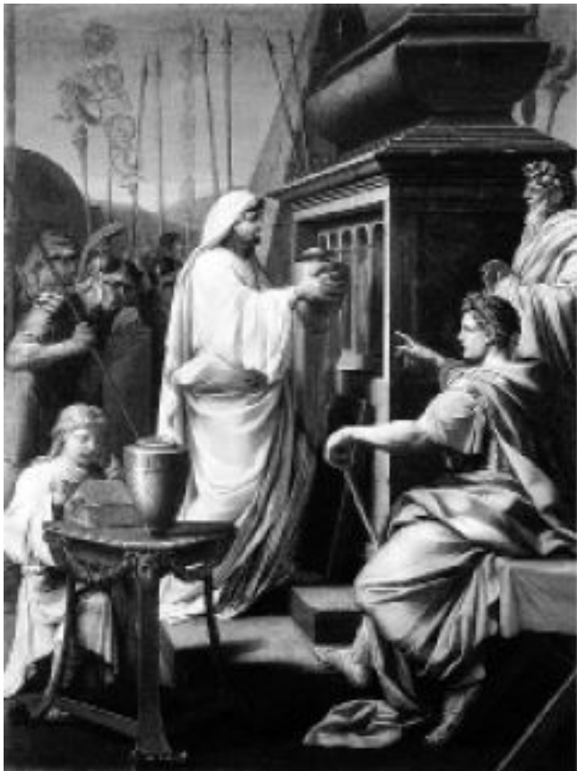
Эсташ Лёсюёр. «Калигула помещает прах матери и брата в гробницу предков». 1647. Виндзорский замок, Виндзор