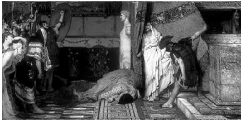
Лоуренс Альма-Тадема. Римский император Клавдий. 1871. Художественный музей Уолтерс, Маунт-Вернон

Понятно, что при таком императоре Сенат утратил какое бы то ни было значение. Он более не утверждал приговоров, да и нельзя было успеть их утвердить. Были попорчены важнейшие идеи Рима, где каждый гражданин (рабы к их числу не относились) чувствовал себя личностью, где действовал принцип римского права: «Да будет выслушана и другая сторона».