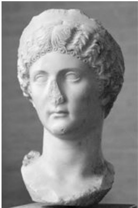
Юлия Друзилла, сестра Калигулы. Глиптотека, Мюнхен