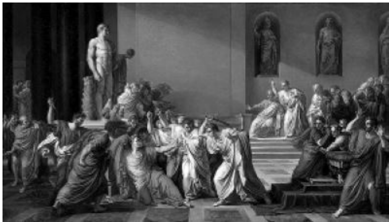
Винченцо Камуччини. Смерть Цезаря. ок. 1806. Музей Каподимонте, Неаполь

зрь: сначала он был избран консулом, затем стал диктатором.