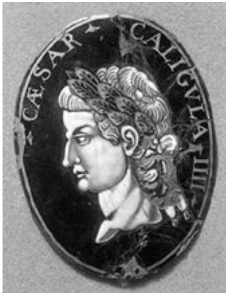
Император Калигула. Позолоченная эмаль. конец XVII – начало XVIII века. Метрополитен-музей, Нью-Йорк