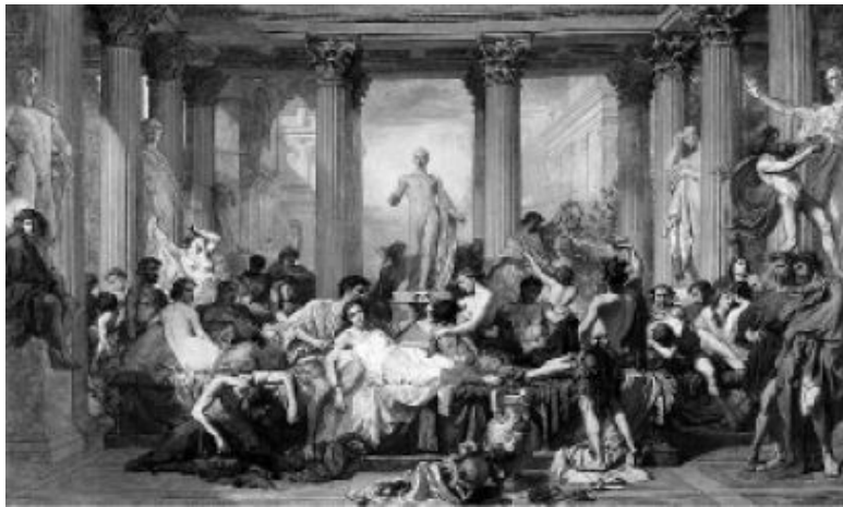
Тома Кутюр. Римляне времен упадка. 1847. Музей Орсе, Париж

Эллинистический тип монархии многое объясняет. Воля правителя абсолютна, она ничем не отличается от воли богов. Если римляне обожествляли императора после смерти, то на Востоке правитель – живой бог на земле. Не случайно Гай Калигула однажды проскакал по улицам Рима в доспехах Александра Македонского: ведь именно Александр провозгласил соединение Востока и Запада.