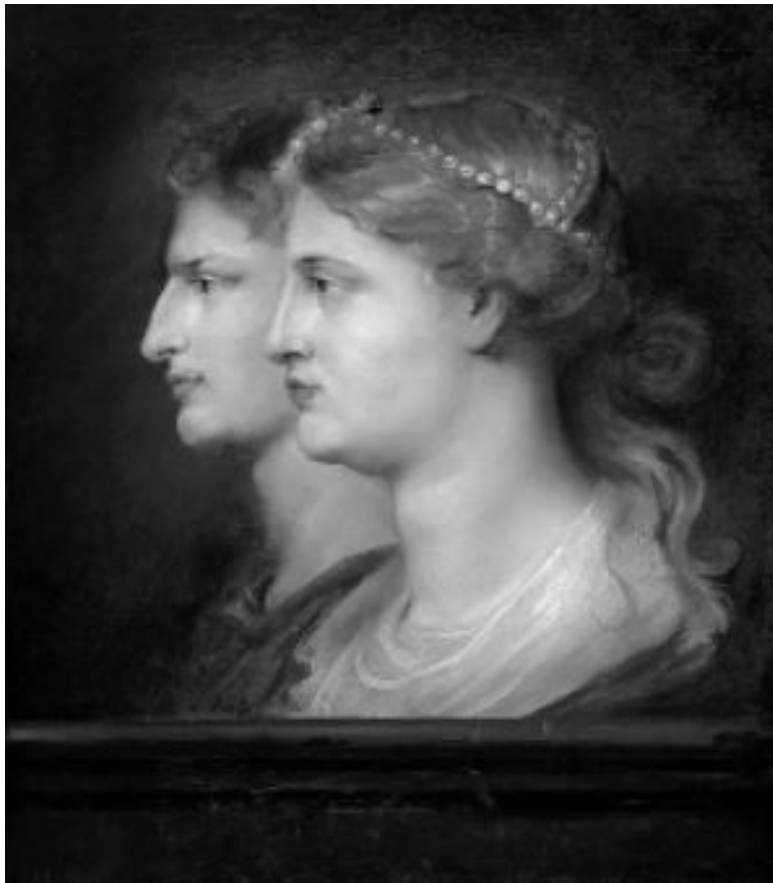
Питер Пауль Рубенс. Германик и Агриппина Старшая. 1614. Национальная галерея искусства, Вашингтон