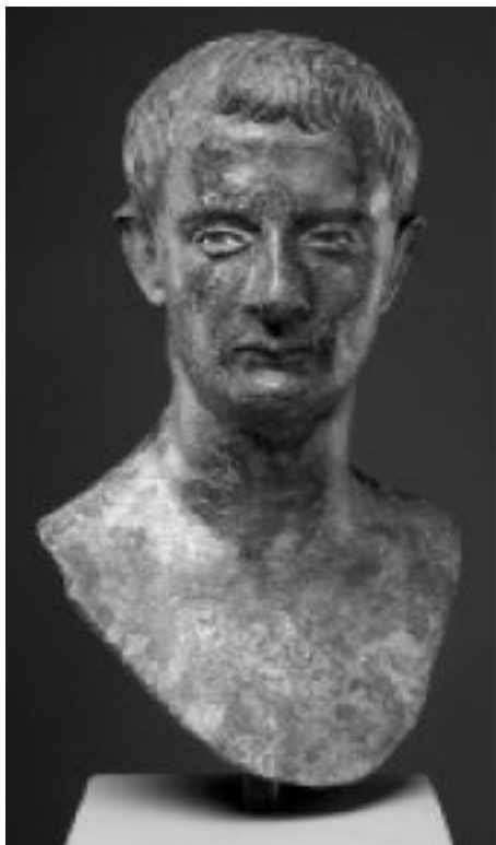
Бронзовый бюст императора Гая (Калигулы). 37–41. Метрополитен-музей, Нью-Йорк

В 33 г. Калигула женился на Юнии Клавдилле. Брак был заключен по любви и выглядел счастливым, но меньше чем через год молодая жена и ребенок умерли при родах. Для Калигулы это был очередной страшный удар судьбы.