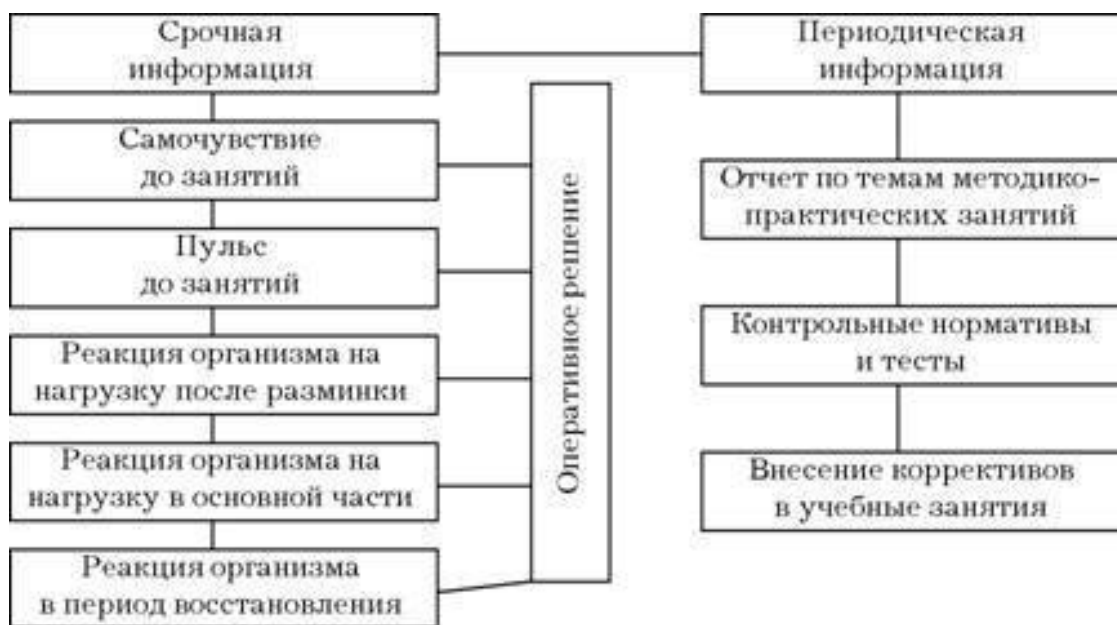
Рис. 1. Схема управления учебным процессом

И. Кант писал: «Именно от структуры системы главным образом и зависят суждения о ее единстве и основательности».