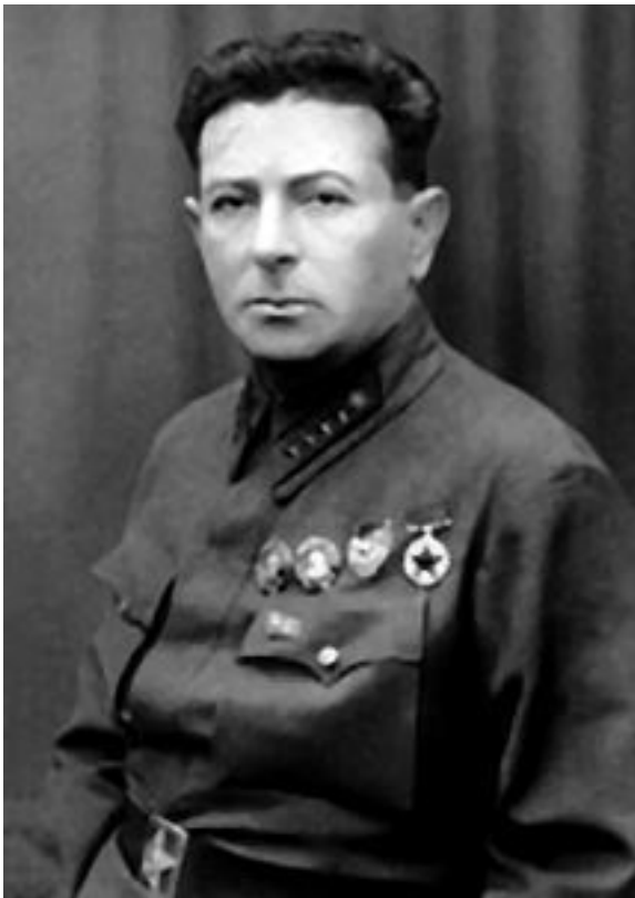
Лев Захарович Мехлис

Да, Мехлис был человек жестокий, и на его совести загубленных судеб много. Но у него было одно позитивное качество – он не врал. Он мог отправить на расстрел человека за прегрешения, которые такой меры наказания не заслужи-