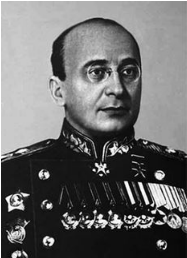
Лаврентий Павлович Берия

Письмо пришло в Москву, но к Сталину оно не попало. Первый входящий в Москве – секретариат Лаврентия Бе-