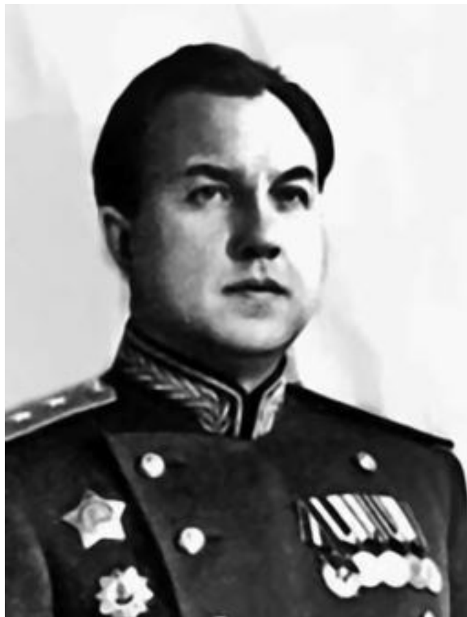
Виктор Семёнович Абакумов