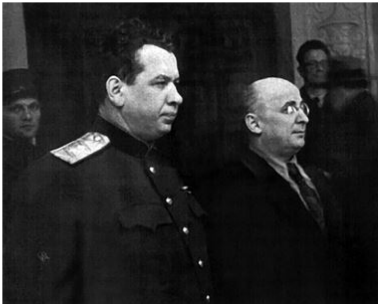
Сергей Никифорович Круглов и Лаврентий Павлович Берия