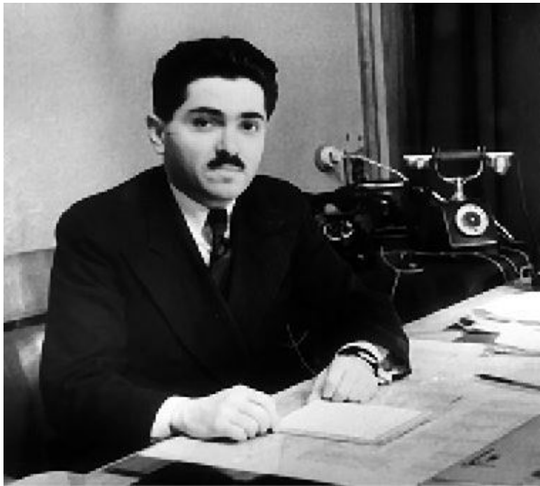
Иван Фёдорович Тевосян