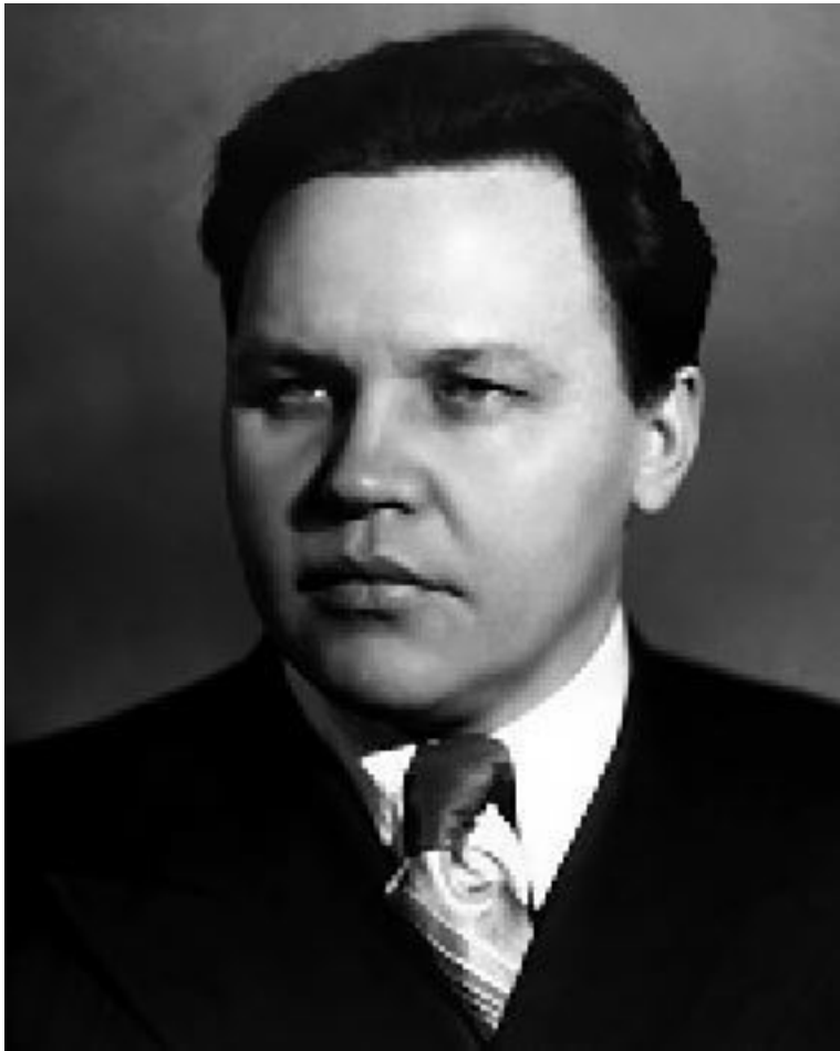
Николай Алексеевич Вознесенский