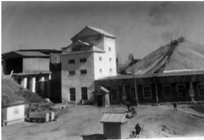
Алмазная обогатительная фабрика. 1948 г.

В 1946–1953 годах СГУ МВД СССР являлось главным поставщиком драгоценных металлов и алмазов в государственную казну. Разумеется, эта структура не была обделена вниманием первых лиц государства и вопросы ее организационного обеспечения и материального снабжения решались в приоритетном порядке. Но в самом СГУ наибольшими привилегиями пользовался «Уралалмаз». Как отмечалось в «Докладе об итогах работы „Уралалмаз“ МВД СССР за 1950 г.»: