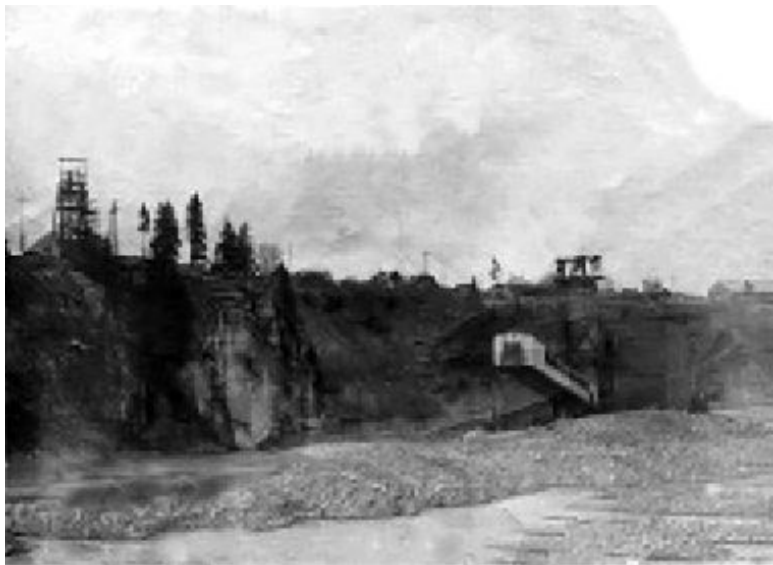
Алмазная драга у Богатского камня

вольствием и промтоварами рабочих и служащих предприятий Главспеццветмета и старательские артели, трест „Золототранс“ ведает транспортировкой продовольственных и промышленных товаров для приисков и рудников, трест „Золоторазведка“ осуществляет разведку недр по добыче металла.